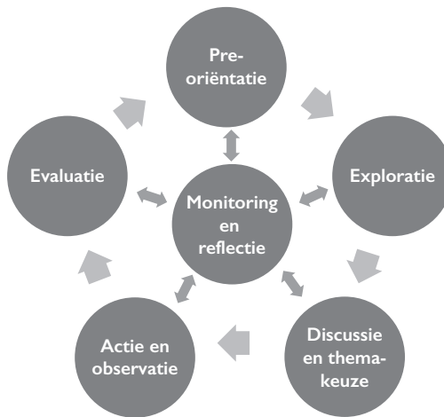
Figuur 2 Aangepaste onderzoekscyclus