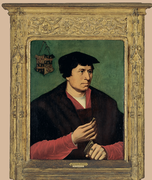
Figuur 4. Middeleeuws schilderij, waarvan met een 14 C-bepaling van de houten lijst een dateringskwesitie kon worden opgelost. Foto: Collectie Stichting Huis Bergh, Inv.nr. 56.