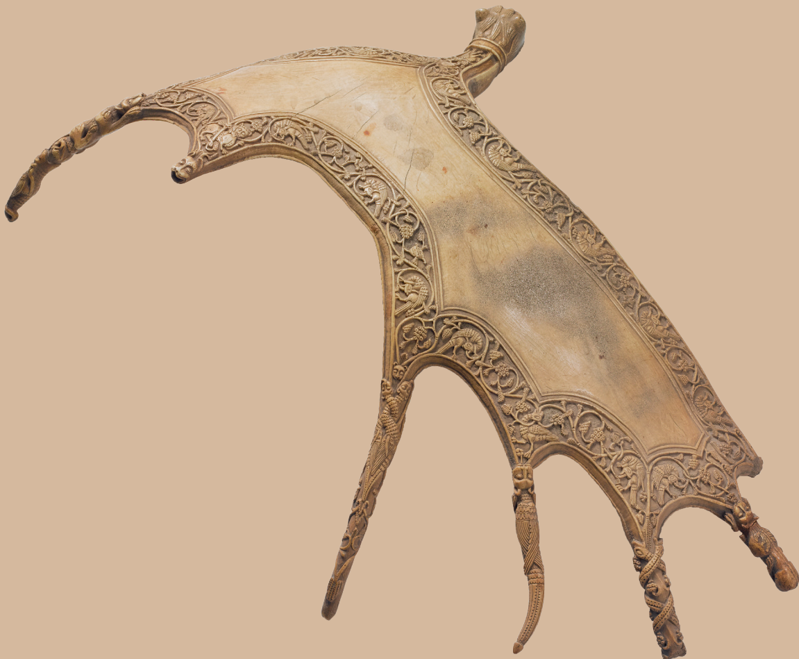
Figuur 3. Schild gemaakt van een elandgewei geassocieerd met Lodewijk de Vrome, wat met ^{14}\text{C} kon worden bevestigd.