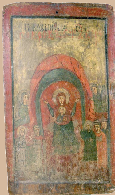
Figuur 5. Kostbaar antiek icoon ( De voorspraak ) uit Kiev, Oekraïne waarvan het hout met 14 C is gedateerd op circa 1000 na Christus.