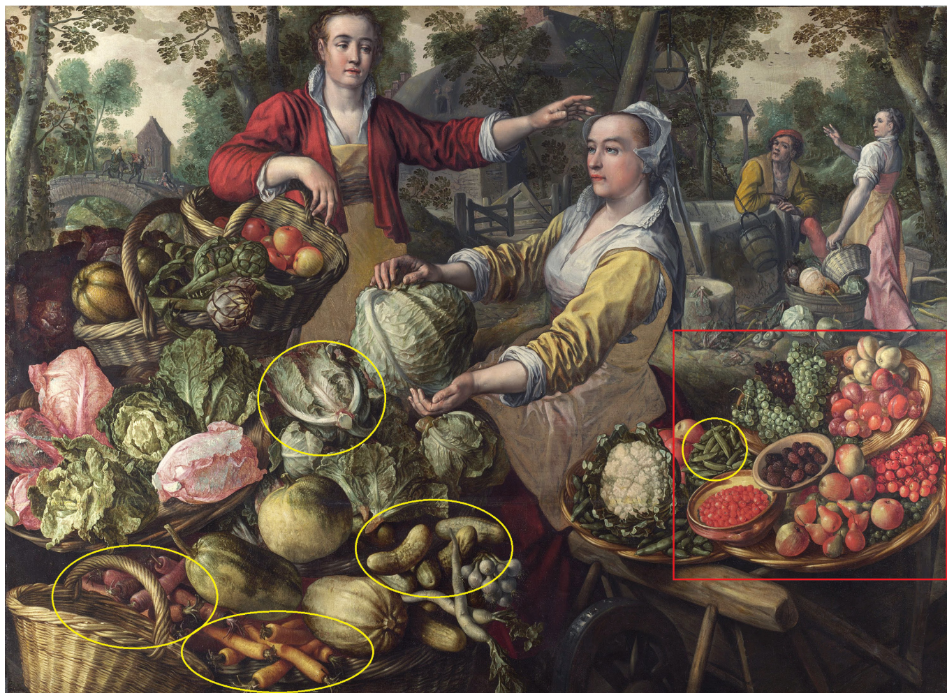
Fig. 3. Joachim Beuckelaer (1569). Titel: De vier elementen: Aarde; groente- en fruitmarkt met in de achtergrond de vlucht naar Egypte. In geel de groenten die in de beerputten zijn aangetroffen. In rood de fruitsoorten die in de beerputten zijn aangetroffen. Via: https://rkd.nl/nl/explore/images .