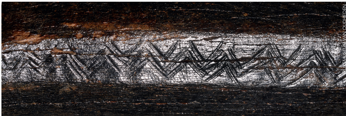
Detailopname van de zigzagversiering zoals aangebracht op de facetten van de bizon metatarsus.