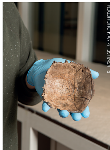
Het schedelfragment van de oudste moderne mens van Nederland.

fragment van een menselijke schedel en een bizonbot met versiering. Alle twee zijn omhooggehaald door vissersnetten en via North Sea Fossils zijn ze beide onder de aandacht gebracht en in collecties terechtgekomen.