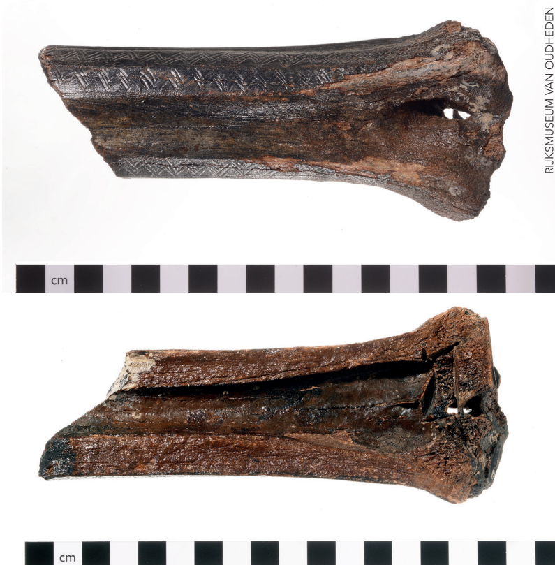
RIJKSMUSEUM VAN OUDHEDEN