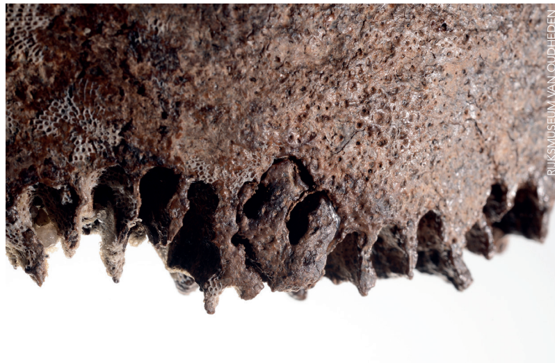
Fragment van het wandbeen, met daarop duidelijk zichtbare de suturen en een stuk aanhechting van het aangrenzende schedeldeel.

Met de opwarming van het klimaat en het oprukken van het bos komen er ook nieuwe mensen naar de noordelijke streken van Europa. Aan de hand van hun lithische inventaris scharen we deze mensen onder de noemer Federmesser -cultuur of traditie. Die