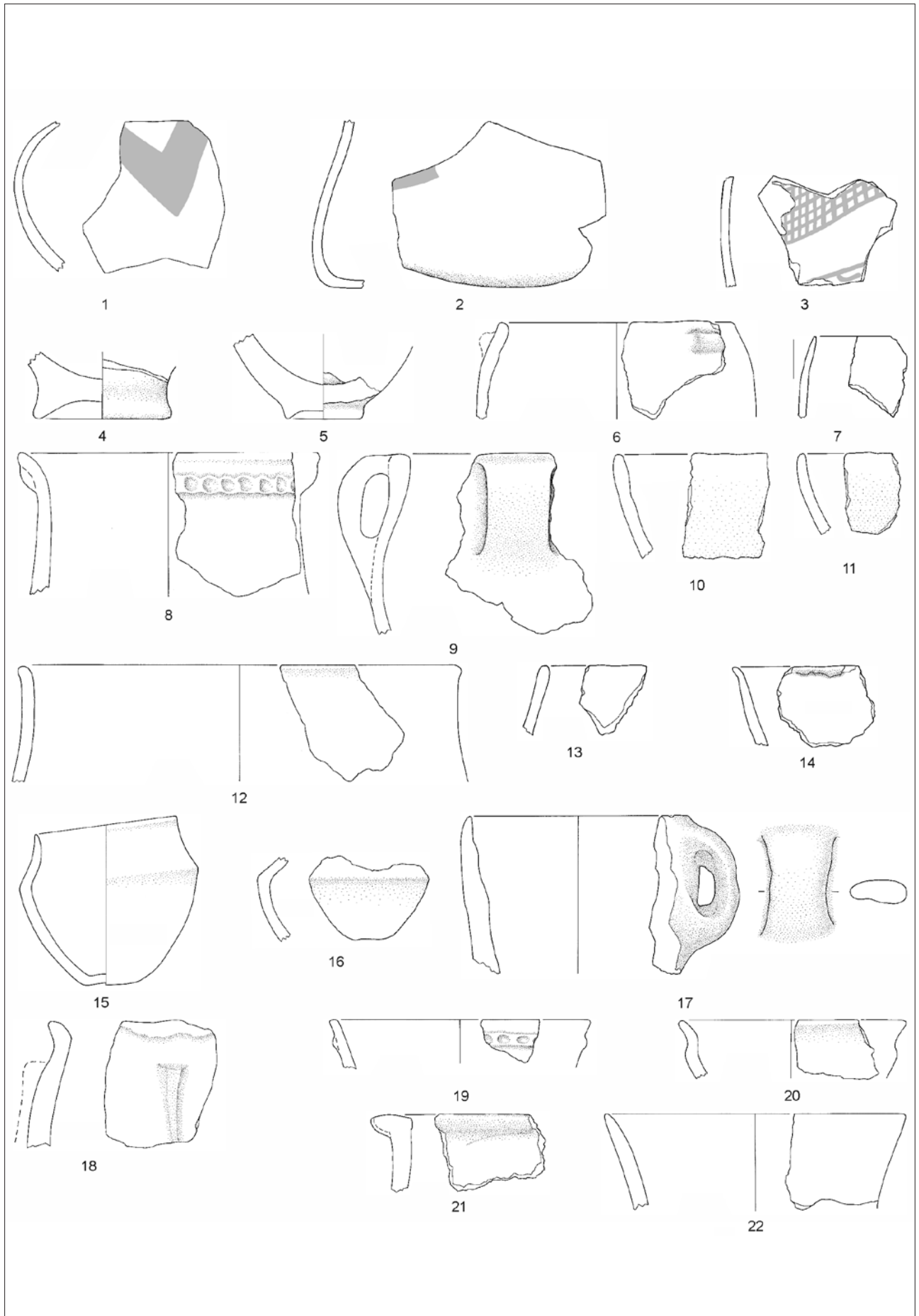
Fig. 1 - S. Angelo II, Galleria dei Vasi (dis. S. Boersma, A. Menduni) (1:4).