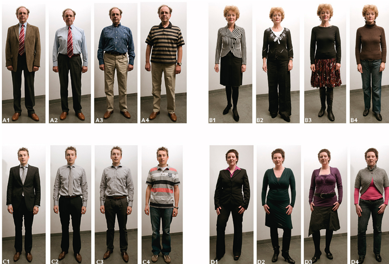
FIGUUR 1 Studie naar effect van kledingstijl op de mate van vertrouwen van de patiënt in de huisarts. Afgebeeld zijn de door patiënten en professionals beoordeelde foto's van 4 typen huisartsen (oudere mannelijke, jongere mannelijke, oudere vrouwelijke en jongere vrouwelijke) in 4 verschillende kledingstijlen: zakelijke, formele, semiformele kleding of vrijetijdskleding (afgedrukt met toestemming van de modellen).

Er werden 2 versies van de fotopresentatie gebruikt. De versies verschilden qua volgorde waarin de foto's werden gepresenteerd, om zo volgorde-bias te voorkomen. De patiënten werden thuis geïnterviewd door getrainde medisch studenten. De patiënten werd gevraagd om de mate van vertrouwen in de getoonde arts aan te geven op een numerieke schaal voor vertrouwen, lopend van 0 (geen vertrouwen) tot en met 10 (volledig vertrouwen).