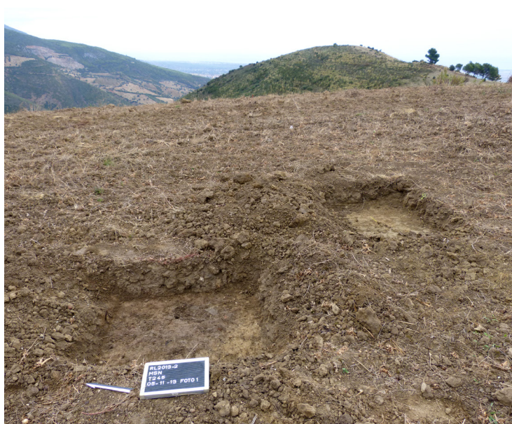
Fig. 8. Op zoek naar de oorzaak van een ronde magnetische anomalie op de noordflank van Monte San Nicola. In het linkervak is een donkere, ronde verkleuring zichtbaar direct onder de ploeglaag (vindplaats RB245a). Rechts: detail van spoor RB245a. Locaties van aardewerkfragmenten zijn omlijnd met witte stippellijnen.