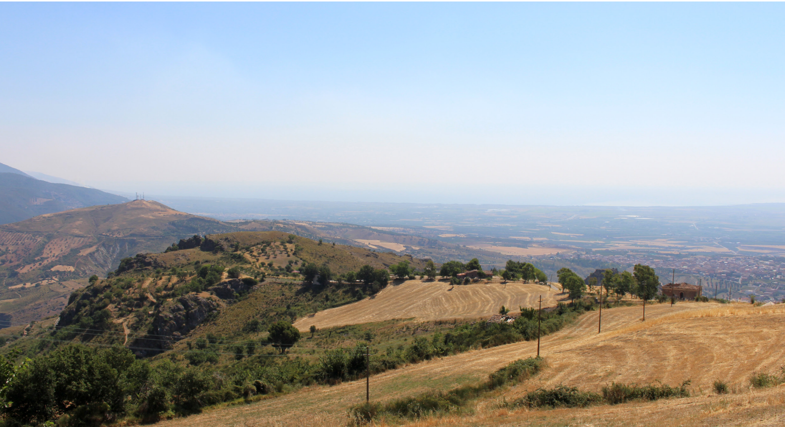
Fig. 2. De Monte San Nicola (links) vanuit het westen. De radiotoren op de top is zichtbaar. Uiterst rechts het plaatsje Lauropoli, in de achtergrond de vlakte van Sibari en de Ionische Golf.