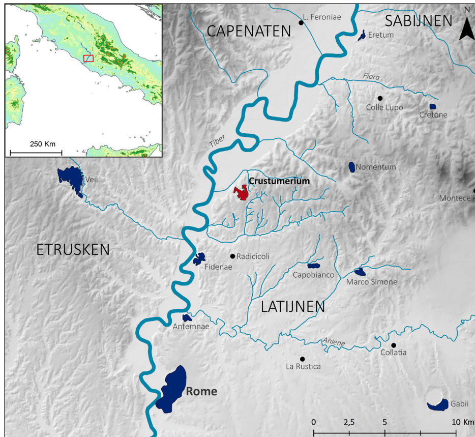
Fig. 1. Kaart van Centraal-Italië met daarop onder andere Crustumerium, Rome en de rivier de Tiber (naar Attema et al. 2016, kaart 1.2).

GIA onder andere een groot aantal grafcontexten kunnen onderzoeken. De graven vormden dan ook het uitgangspunt van de tentoonstelling Crustumerium, Death and Afterlife at the Gates of Rome in de Ny Carlsberg Glyptotek in Kopenhagen. De expositie werd op 19 mei officieel geopend en was te bezichtigen tot en met eind november 2016. Binnenkort zullen enkele objecten opnieuw te zien