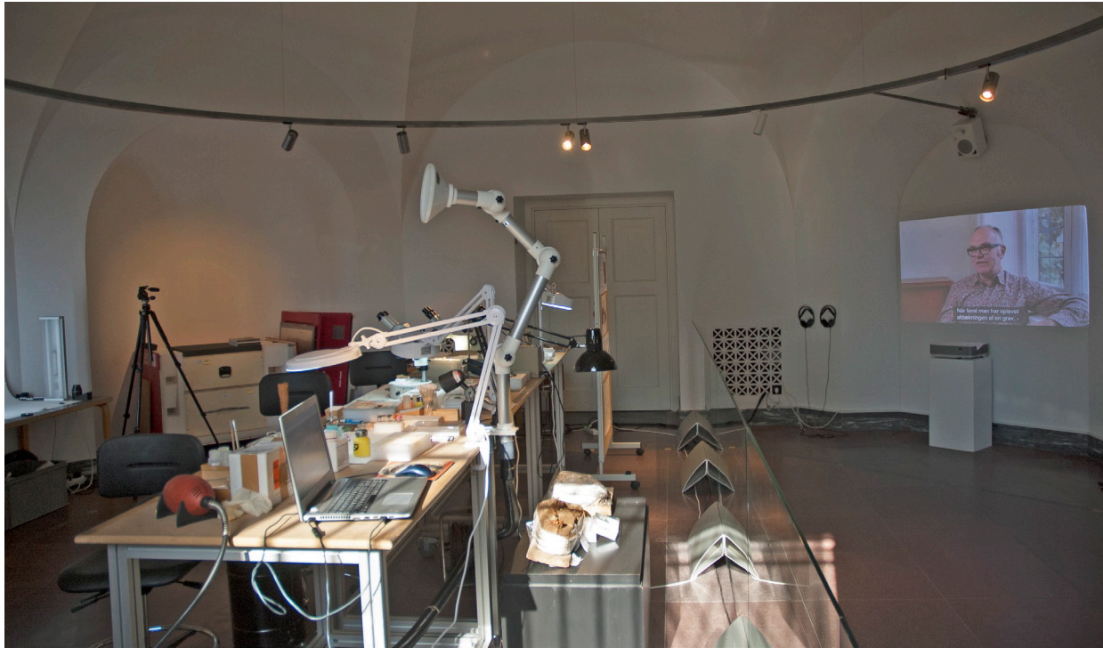
Fig. 6. De laboratoriumruimte in het museum. Op de muur werd een korte documentaire over het conservatiewerk geprojecteerd.

worden aangetrokken door dit soort toepassingen, en omdat musea graag grote aantallen bezoekers zien, wordt er vaak toe overgegaan om dergelijke interactives in een tentoonstelling op te nemen. Tegenwoordig wordt de effectiviteit van zulke middelen echter steeds meer in twijfel getrokken; zijn ze behalve 'leuk' ook 'leerzaam'?