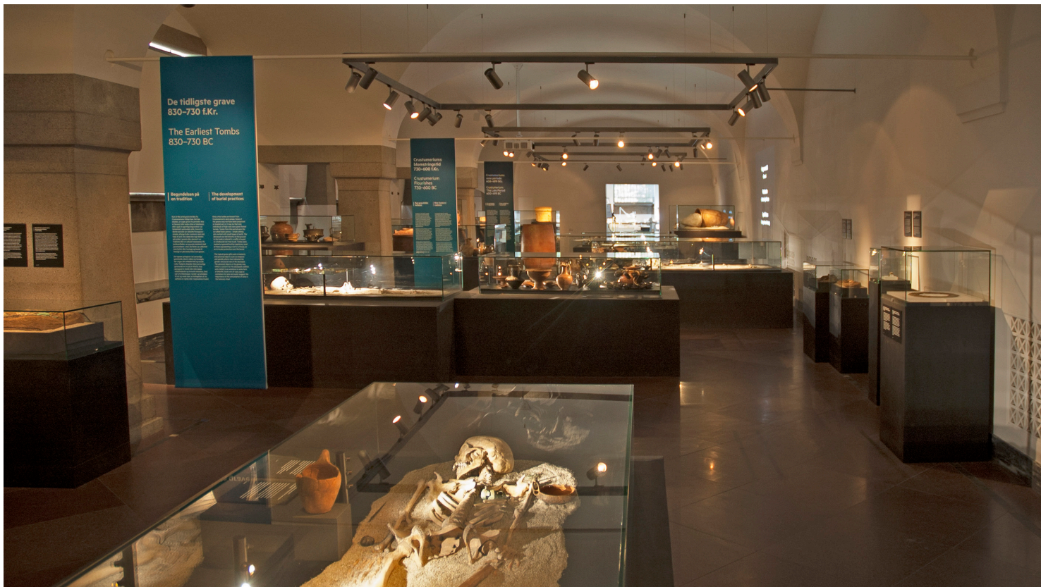
Fig. 4. Overzichtsfoto van de tentoonstellingsruimte in het souterrain van de Ny Carlsberg Glyptotek.

bezoeker: van opgraving tot tentoonstelling. In plaats van alleen het eindresultaat te presenteren in de vorm van een prachtig gerestaureerde vaas zonder (zichtbare) breuken, zoals in het verleden gebruikelijk was, werd er in de Glyptotek voor gekozen alle processen, bewerkingen en afwegingen die aan de uiteindelijke tentoonstelling voorafgaan, expliciet te tonen. Tevens werd hierdoor inzichtelijk gemaakt hoe veel deskundigen bij de totstandkoming van de tentoonstelling betrokken zijn: het museum is afhankelijk van het werk van diverse specialisten, zoals archeologen, restauratoren en technisch tekenaars.