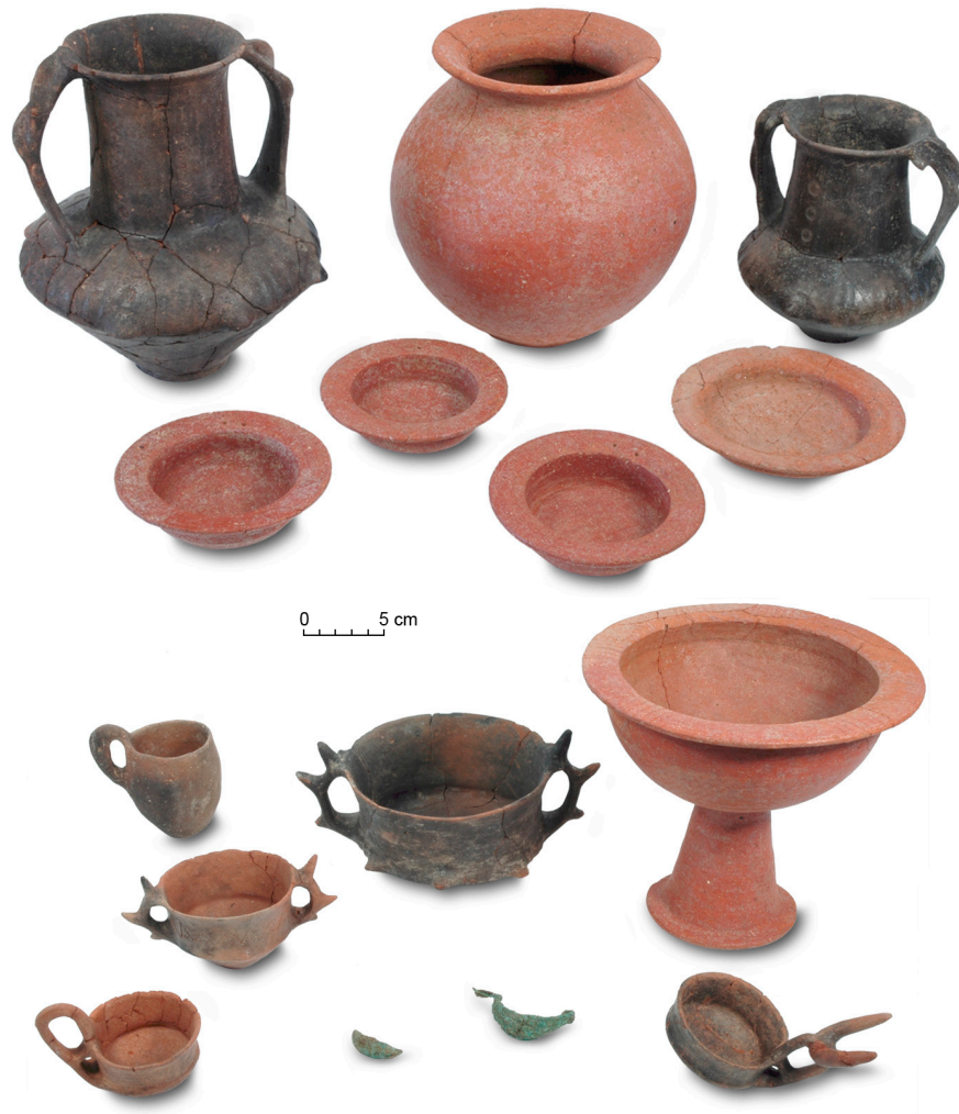
Fig. 3. Een voorbeeld van een typische 7 de -eeuwse grafassemblage uit Crustumerium (foto Gert van Oortmerssen, RUG/GIA).

(de zogenaamde fossa -graven) tot graven waarin een nis was uitgehakt voor de bijzetting van het aardewerk, en weer later werden ook nissen voor de begraving van de dode gecreëerd (de loculus -graven) (fig. 2). In de laatste fase van de grafvelden, vanaf de late 7 de eeuw v.Chr. verschijnen er voor het eerst kamertombes, bedoeld voor de bijzetting van meer dan één dode.