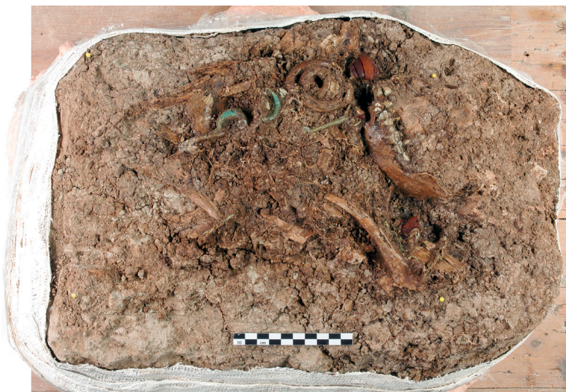
Fig. 5. Block-lift van tombe 59 waarbij het bovenlichaam van de overledene met de ondergrond erbij is gelicht (naar Attema et al. 2016, fig. 5.4).

een vrachtwagen vanuit Rome naar Kopenhagen gebracht, en bij het museum afgeleverd.