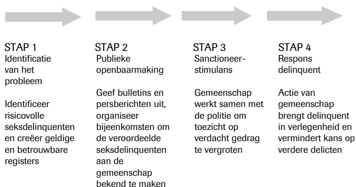
Figuur 1: Het beoogde proces voor Megan's Law

In het onderzoek werden deze deeltheorieën stuk voor stuk getest, waarbij honderden bestaande studies werden doorgenomen om een goed onderbouwde beslissing te kunnen nemen of de wet werkte. De drie cases hieronder geven een indicatie van de kracht van een theoriegestuurde aanpak in synthetiserend onderzoek.