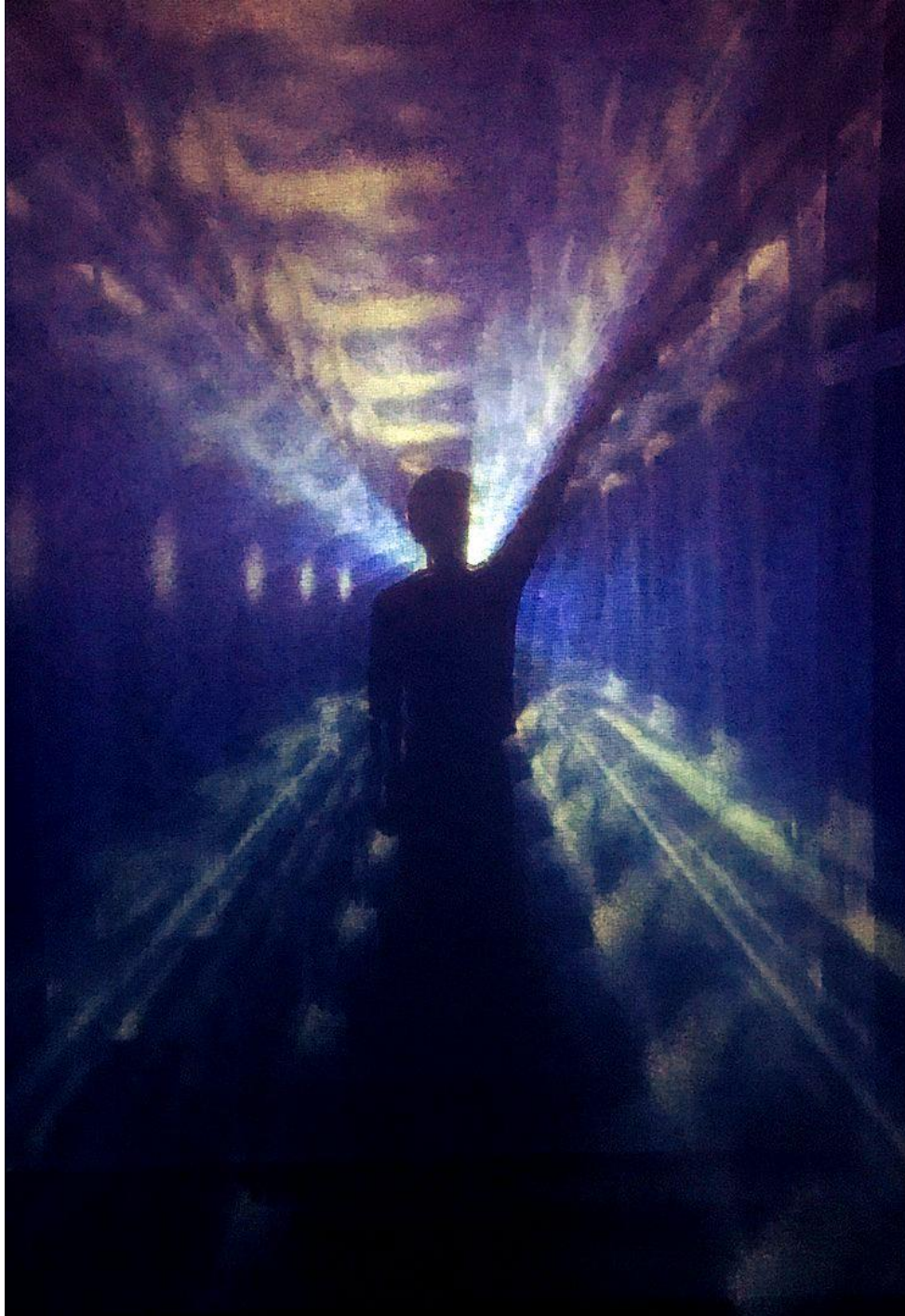
Image "Self" by Izuru Mizutani - Own work, CC BY-SA 4.0 via https://commons.wikimedia.org/w/index.php?curid=89738798

το χρονικό τέντωμα χωράνε όλα μου τα συναισθήματα και οι σκέψεις: οι εγκαταλείψεις και οι αγάπες μου, οι δυστυχίες και οι ευτυχίες μου, οι ήττες και οι νίκες μου, οι δημιουργίες και τα ατοπήματά μου. Πότε άλλοτε στην ζωή μου δεν ήρθα τόσο κοντά σε αυτά, εξερευνώντας τα υπό συνθήκες «καραντίνας» αλλά νιώθοντας απολύτως ελεύθερη να παίζω μαζί τους, να τα προσεγγίσω, να τα εγκαταλείψω, να τα διαμορφώσω, να τα προσπεράσω, ή να τα αποδεχτώ σε όλο τους το υπερβατικό μεγαλείο.