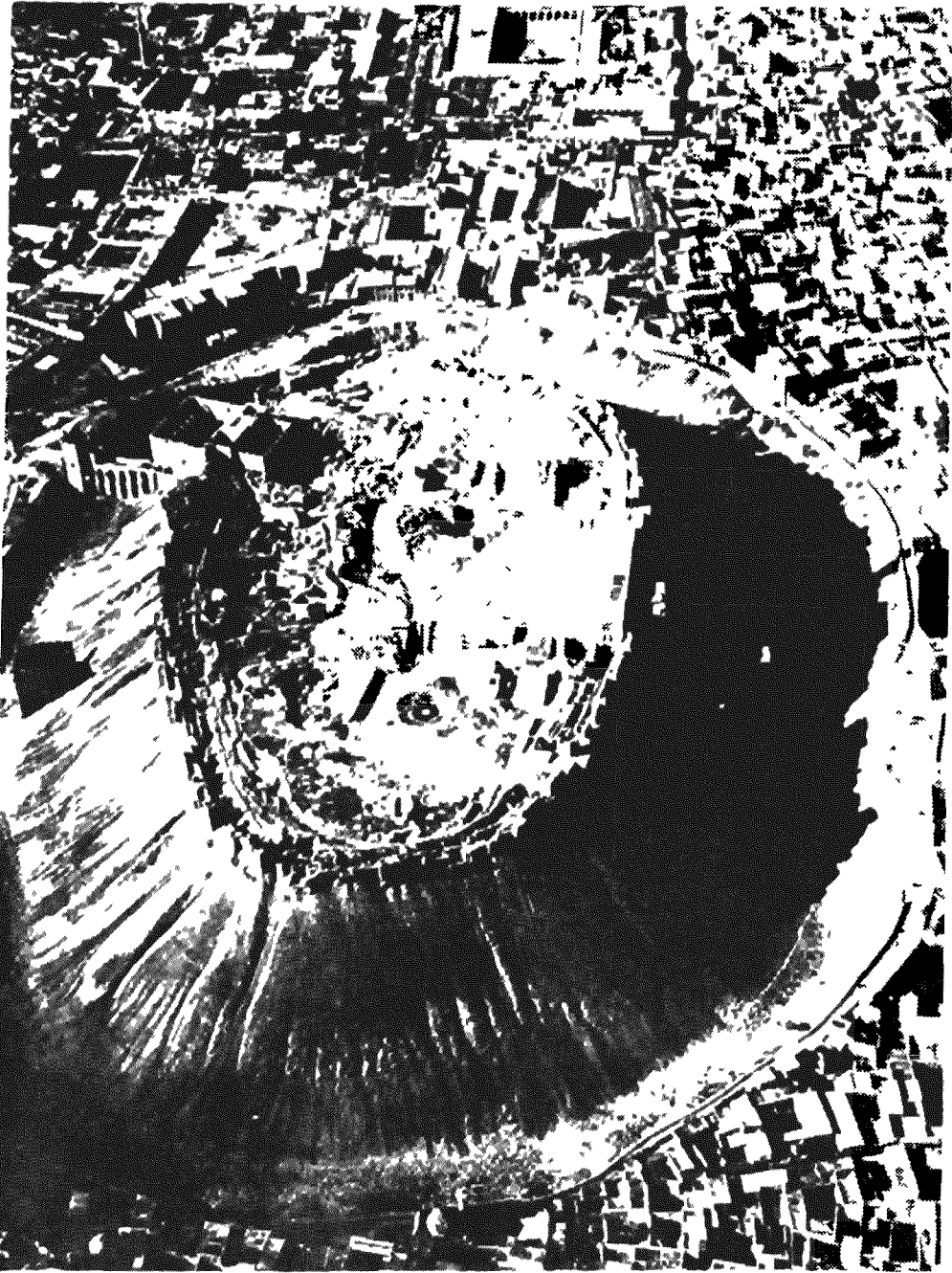
Alep: la citadelle (F Braudel, La Méditerranée . . , Paris (1977), p. 191, no 350).