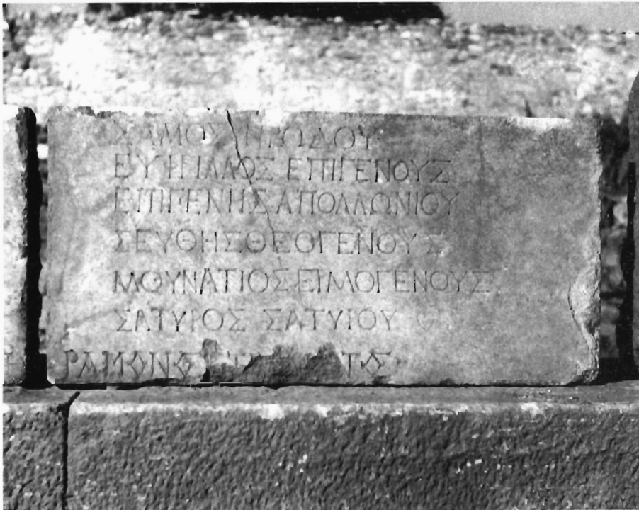
M.-G. Parissaki, Fig. 3