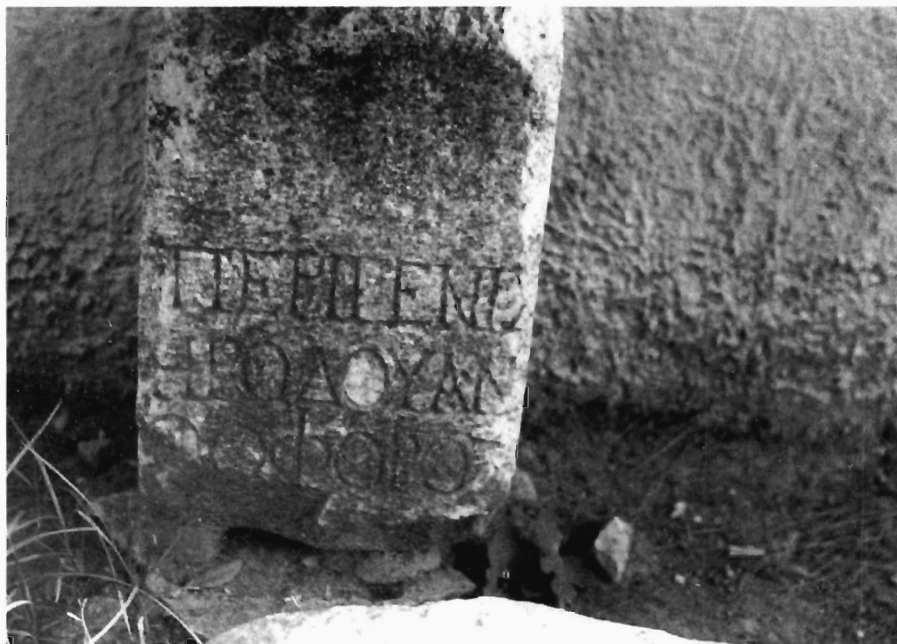
M.-G. Parissaki, Fig. 2