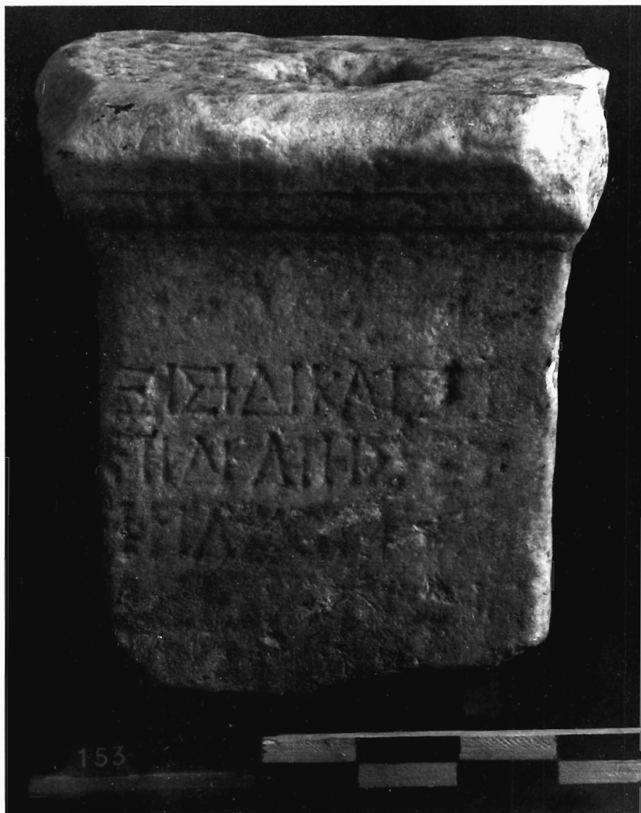
M.-G. Parissaki, Fig. 4