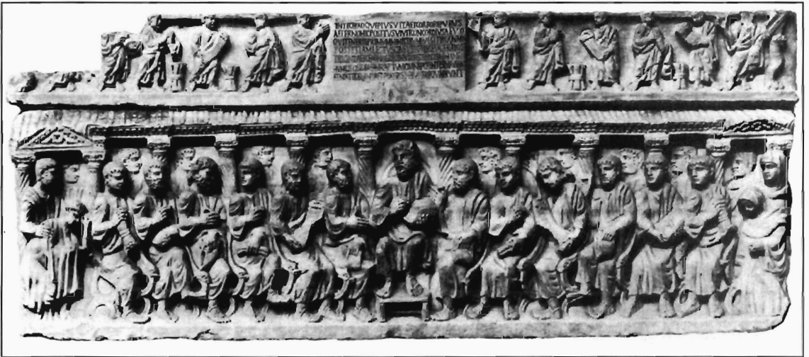
W. Binsfeld, Abb. 2: Sarkophag in Arles, nach Le Bland 1878