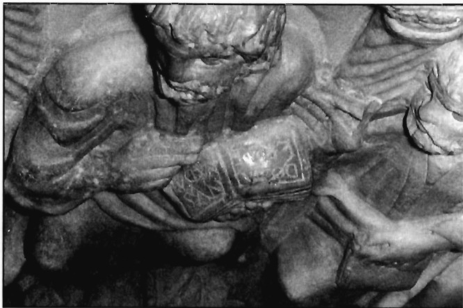
W. Binsfeld, Abb. 3: Sarkophag in Arles, Inschrift auf Christi Codex