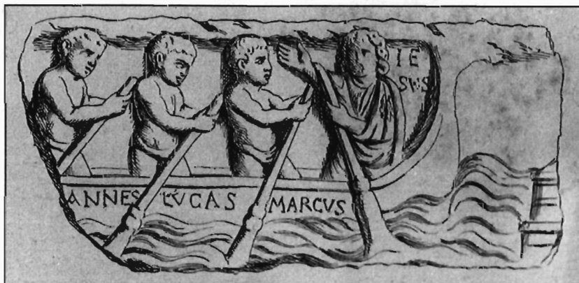
W. Binsfeld, Abb. 5: Sarkophagdeckel in Vatikan, nach Garrucci 1879