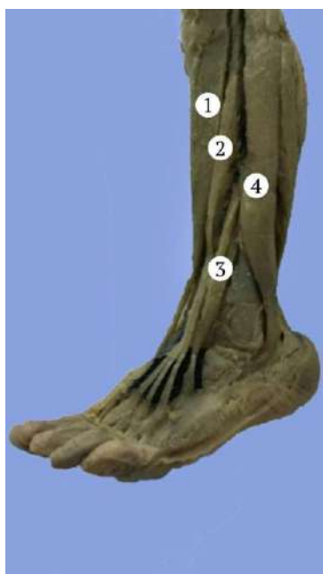
Рис. 3. Ліва передньо-бічна гомілкорова ділянка плода 175,0 мм ТКД. Фото макрорепарату. Зб. 2,3 х : 1 – передній великогомілковий м'яз; 2 – черевце довгого м'яза-розгинача пальців; 3 – додаткова нижня голівка довгого м'яза-розгинача пальців; 4 – довгий малоогомілковий м'яз

Черевце довгого м'яза-розгинача пальців починалося від бічного виростка великогомілкової кістки та верхньої третини міжкісткової перетинки і далі переходило в товстий спільний сухожилок, який на тильній поверхні стопи розділявся на три сухожилки, що прикріплювалися до основ середніх та кінцевих фаланг II–IV пальців. Додаткова нижня голівка довгого м'яза-розгинача пальців починалася від переднього краю середньої третини малоогомілкової кістки та прикріплювалася окремим сухожилком до основ середньої та кінцевої фаланг V пальця. Виявлені у плодів людини анатомічні варіанти м'язів передньої групи гомілки були однобічними.