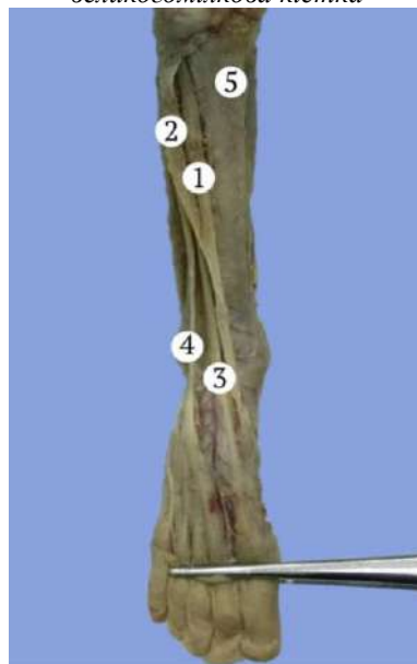
Рис. 2. Права передня гомілкoва ділянка плода 105,0 мм ТКД. Фото макропрепарату. Зб. 2,5 х : 1 – присередня голівка переднього великогомілкового м'яза; 2 – бічна голівка переднього великогомілкового м'яза; 3 – сухожилок довгого м'яза-розгинача великого пальця; 4 – сухожилок довгого м'яза-розгинача пальців; 5 – великогомілкoва кістка