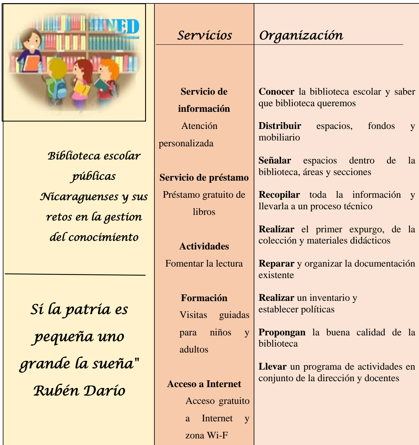
Bibliotecas escolares y sus servicios innovadores y organización Cuadro N° 4 propia servicios de la biblioteca y su organización.