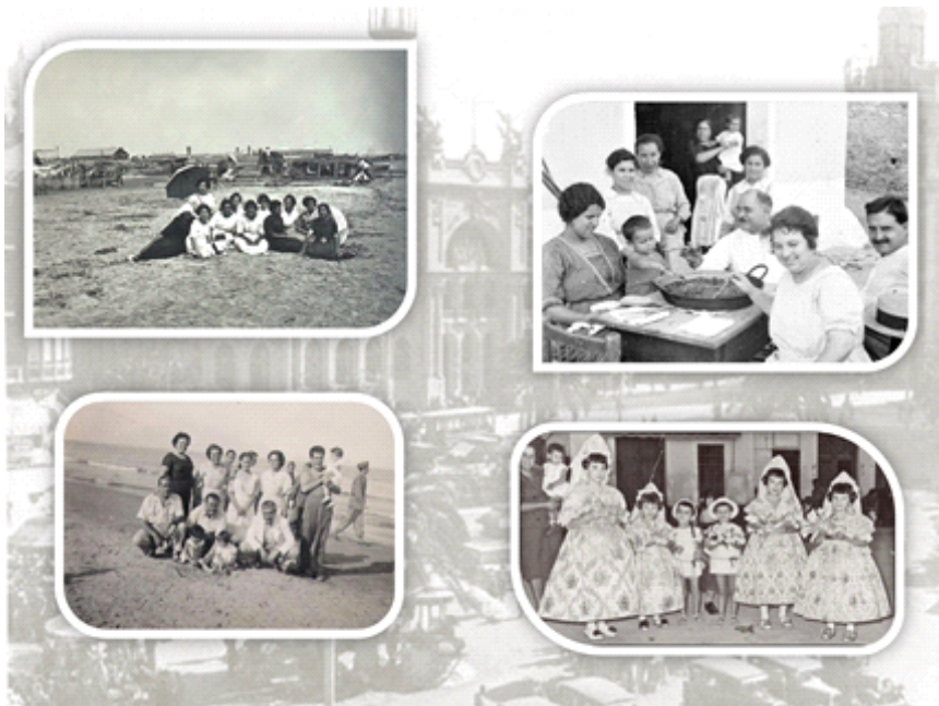
Figura 3 - Fragmento de uno de los foto-ensayos presentados por el alumnado derivados del álbum

- Podemos señalar que se aprecia como relevante el papel que desarrolla en todo momento la madre como esposa, cuidadora de sus hijos y una mujer ama de casa. Asimismo, como idea subyacente, las imágenes transmiten o visibilizan de forma contextualizada los roles que tradicionalmente se han asignado a los sexos, sobre todo se plasma el femenino y se manda un mensaje social sobre cómo era o debía ser una “buena mujer”, hace ya unas cuantas décadas.