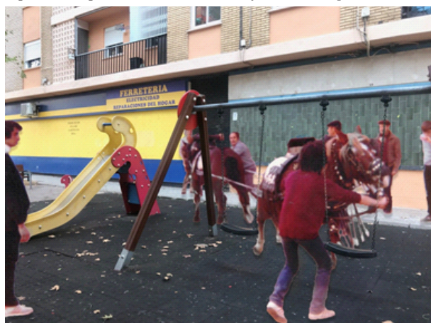
Figura 2 - Fotografía de uno de los foto-ensayos elaborados por una alumna.

Iremos analizando el resultado del análisis de estos foto-ensayos utilizando las transcripciones y anotaciones de las sesiones del focus-group que en ocasiones se citarán literalmente en el texto, como un documento esencial para el desarrollo analítico de este trabajo.