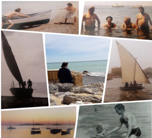
Figura 5 - Foto ensayo de un alumno contraponiendo imágenes familiares del pasado con el presente

Como vemos, se destaca en muchos de los comentarios transcritos esa necesidad de construir lo individual a partir de lo colectivo, todo ello presente de forma clara en las narrativas de los foto-ensayos.