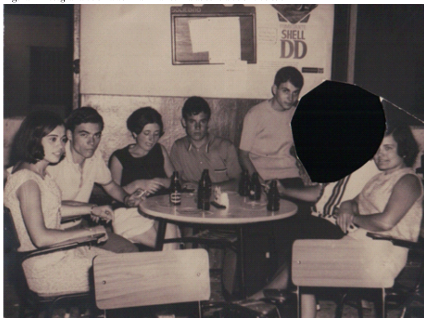
Figura 1 - Fotografía de un álbum familiar con la ausencia de uno de sus

Nunca supe con certeza el origen de aquellas ausencias, aunque en mi caso descubrí más tarde que se trataba de una ausencia simbólica de un hijo cuyo comportamiento frente a la familia no había sido el adecuado. Pero el fin de esa ausencia en las fotos no era apartarlo, sino precisamente recuperarlo. Casi como una especie de ritual mágico, las imágenes recortadas e individualizadas se habían separado y colocado en otro lugar especial, a veces expuesto públicamente o enmarcado junto a una vela encendida, como señal de protección y con ánimo de recuperarlo para la familia, como sí de una persona fallecida a la que se recuerda se tratase.