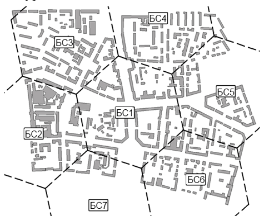
Рис. 1. Модель фрагмента городской застройки центральной части Минска с размещенными в нем семью БС (БС1-БС7)

– типы антенн БС: при оценке уровней полезного сигнала АС – всенаправленная; при оценке SNIR – секторная с шириной диаграммы направленности в горизонтальной плоскости 90° по уровню –3 дБ.