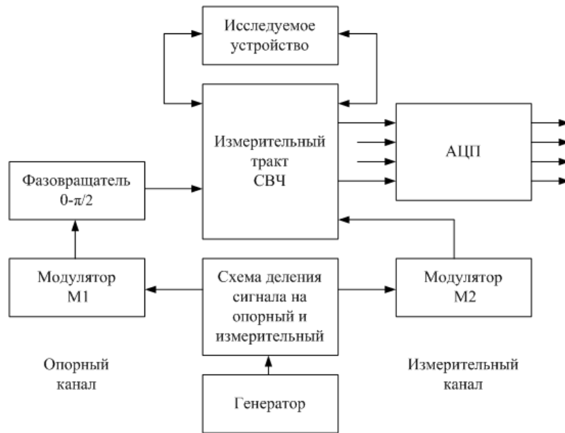
Рис. 2. Структурная схема СВЧ тракта, используемого для получения квадратурных сигналов в ВАЦ 75–110 ГГц

бинарного фазовращателя, осуществляющего фазовую коммутацию опорного сигнала по алгоритму 0-\pi/2 . Структурная схема волноводного СВЧ-тракта приведена на рис. 2.