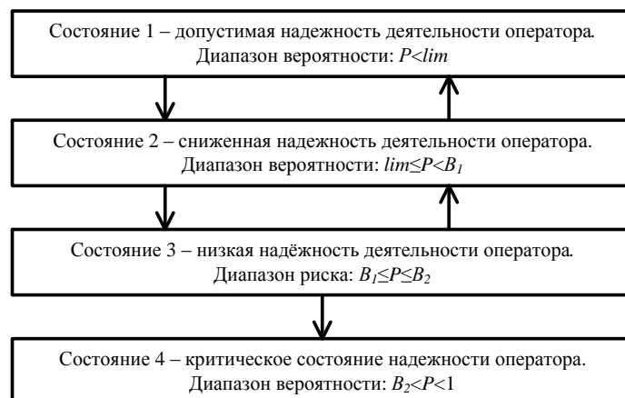
Рис. 1. Информационная модель изменения надежности деятельности операторов опасных производств

деятельности оператора, его ПХ находятся в пределах нормы. Первое состояние характерно для операторского персонала, когда вработывание уже произошло, а количество ошибок, совершаемых оператором, практически равно нулю.