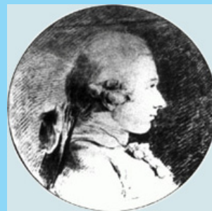
Marquês de Sade (1740-1814)