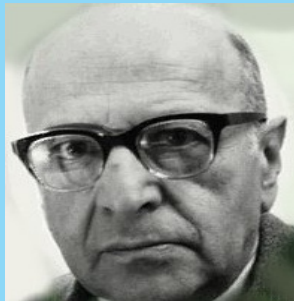
Theodor Adorno (1903-1969)