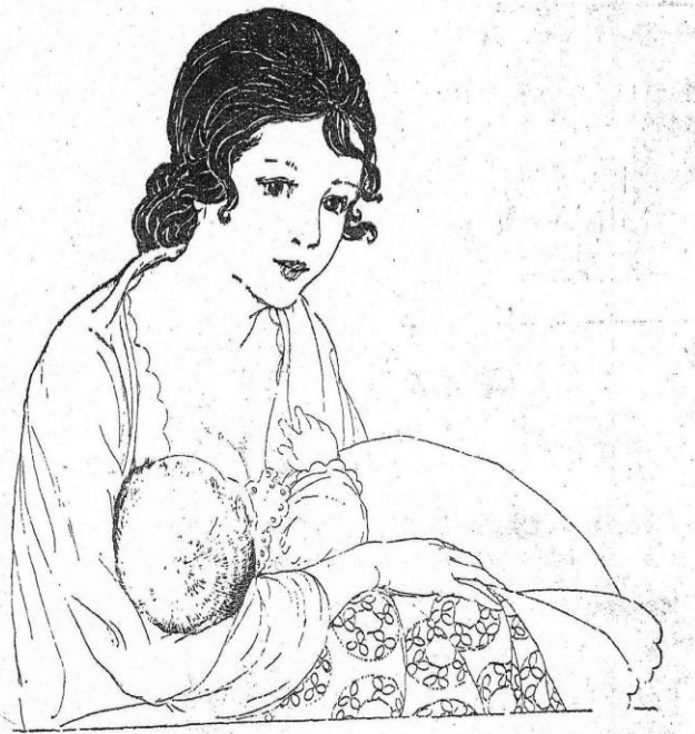
Ilustración 12 ( Cromos 706, Abril 12 de 1930).