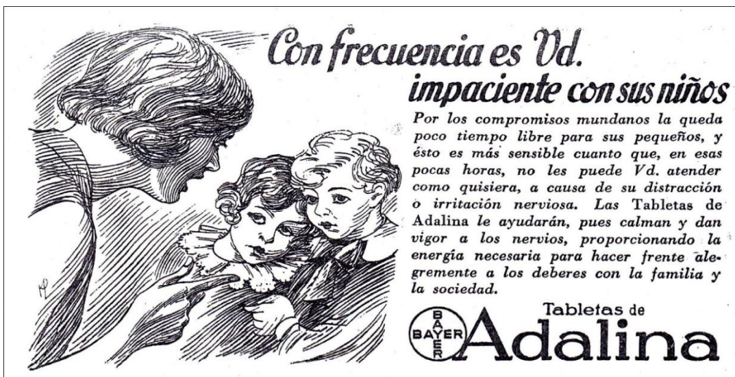
Ilustración 16. (Cromos 760, Mayo 2 de 1931)