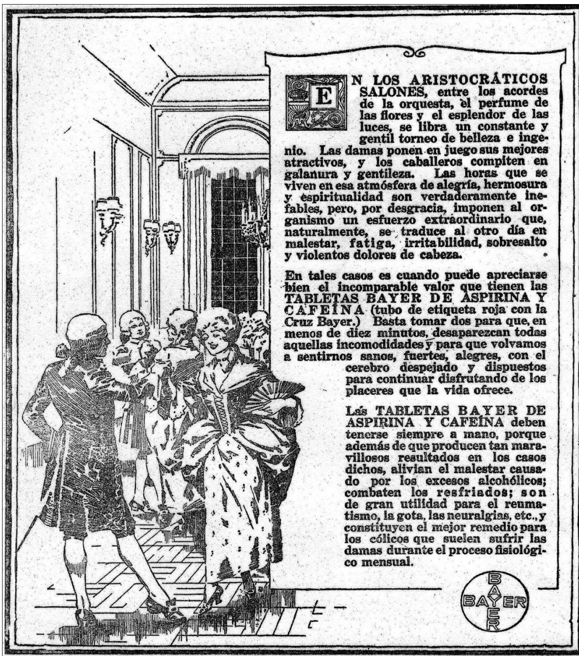
Ilustración 2. (Cromos 244, Feb 5 de 1921)

Lo inquietante de este proceso de construcción del sujeto consumidor de mercancías es que a la mujer se le otorgó un rol diferenciado, un papel específico para promover el modelo de identificación como padre primordial. La perfección del cuerpo de la mujer