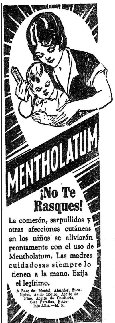
Ilustración 8 ( Cromos 705, Abr. 5 de 1930) (izquierda)