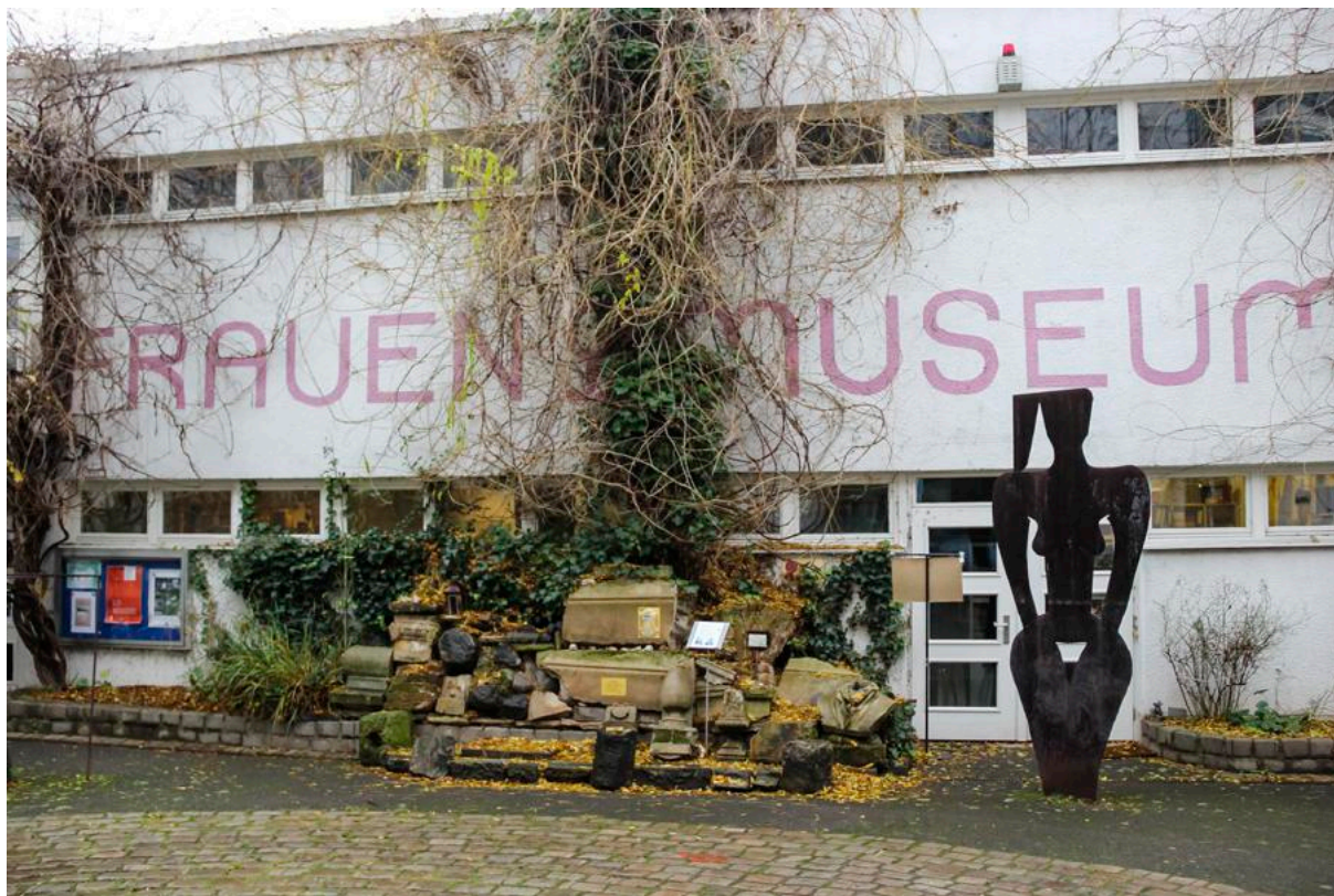
Frauenmuseum. Bonn. Gertrudiskapelle.