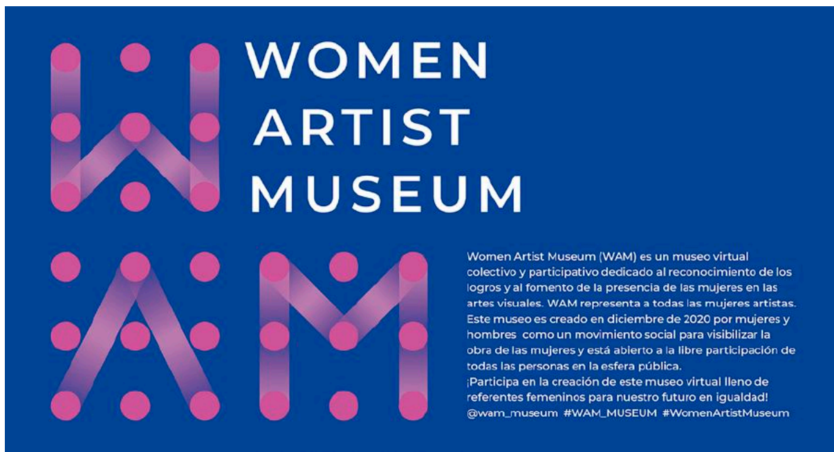
Cartel de la intervención pública en el Ágora del Campus de la UPV ideada por la artista Mau Monleón Pradas con la colaboración de la artista María Penalva-Leal. Correspondiente a la tercera acción de la posteriormente consolidada Colectiva Portal de Igualdad, 29 diciembre 2020.