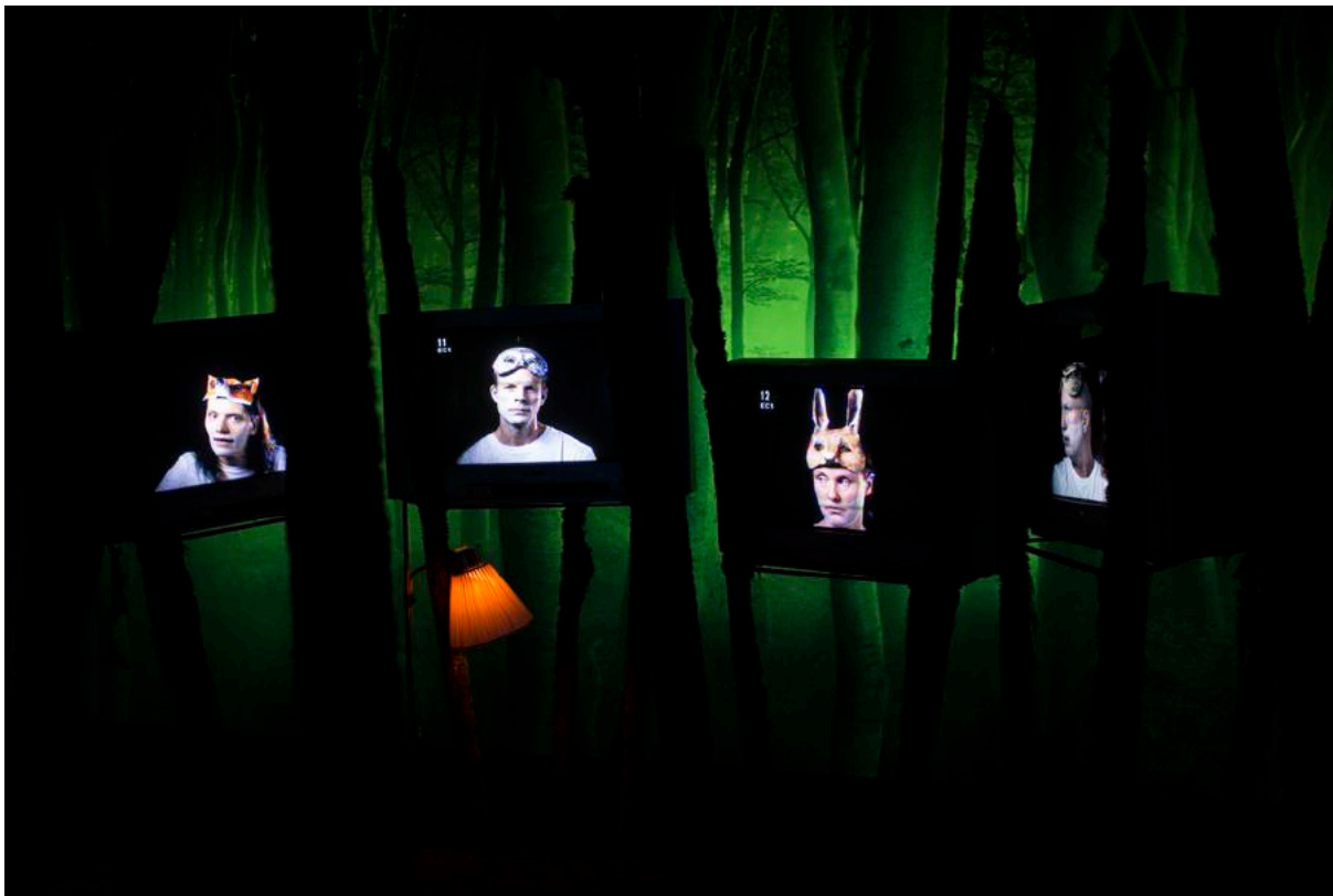
Exposición Roots - a Tangled History. A dark story about gender & power, Identity & history Kvinnohistoriskt museum, Umeå (Suecia).

dos dentro de la feria donde se exhiben obras individuales, se expusieran solamente obras de autoría femenina. Sin embargo, al no contar con alguna estadística contrastable, no se puede decir con seguridad en qué grado la situación ha variado o no. Ahora bien, dado que los cambios sustanciales no se producen de la noche a la mañana, lo más probable es que se siga manteniendo el porcentaje mínimo que ya se reveló en la edición pasada, gracias al informe MAV 2020. Un documento que desvela que el porcentaje apenas se ha movido, manteniéndose en un escaso 7%, una dinámica que ha sido, más o menos, la habitual en estos diez últimos años.