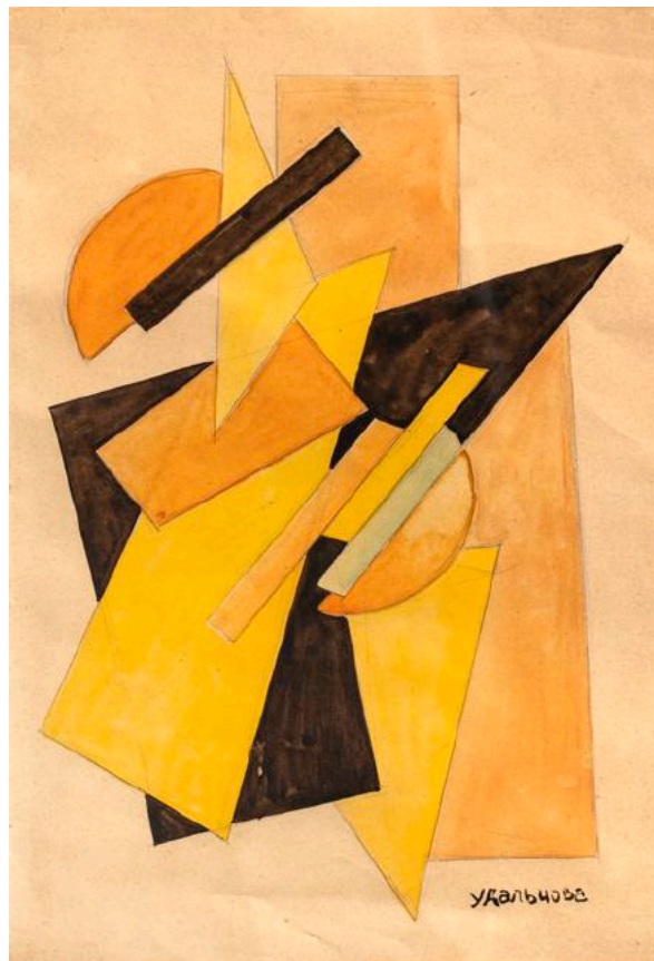
Acuarela y lápiz sobre papel de Nadezhda Udaltsova de 1916, actualmente en el Museu d'Art Contemporani Vicente Aguilera Cerni de Vilafamés procedente de la colección Fracaral.

En cualquier caso, aún queda mucho por conseguir, máxime cuando no bastan las declaraciones formales y lo que se demanda es que la igualdad sea real y efectiva. Sin embargo, en los últimos años se están abriendo diversos cauces para que los museos caminen hacia la equidad. Un ejemplo cercano es el proyecto Relecturas. Itinerarios Museales en Clave de género , subvencionado por la Generalitat Valenciana a partir de un estudio de la Universitat de València. Se trata de un proyecto donde varios museos valencianos presentan sus colecciones desde una perspectiva de género, invitando al público a reflexionar sobre los mitos patriarcales y la desigualdad estructural con la que históricamente se han diferenciado los roles y las funciones entre los sexos. En esta iniciativa participan diversas tipologías de museos como