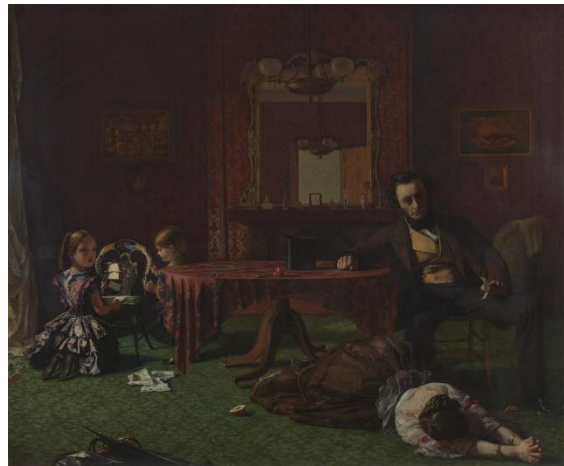
図8 オーガスタス・レオポルド・エッグ《過去と現在 I》

ここまでの情報を整理すると、ベル夫妻とフライそれぞれのシッカート批判は、実はその焦点が全く異なっていることが分かる。フライが《エコーズ》に全く触れていない点も加味すれば、フライがイギリス人モダニストの中心人物であったとは言え、やはり《エコーズ》批判とフライは完全に切り離して考えるべきなのだ。