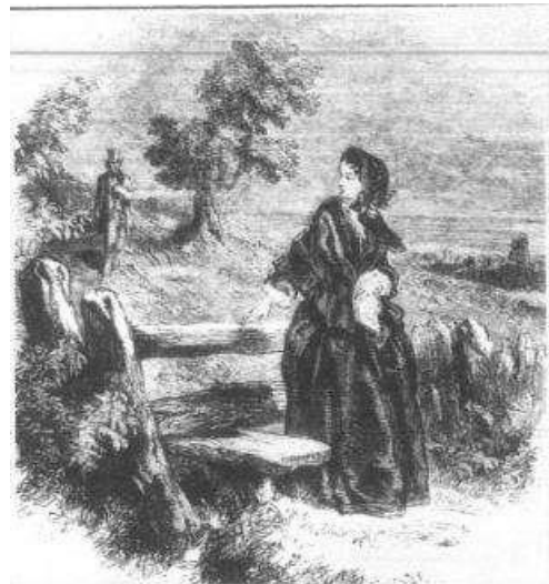
図2 ジョン・ギルバート 《予期せぬ遭遇》 木版画