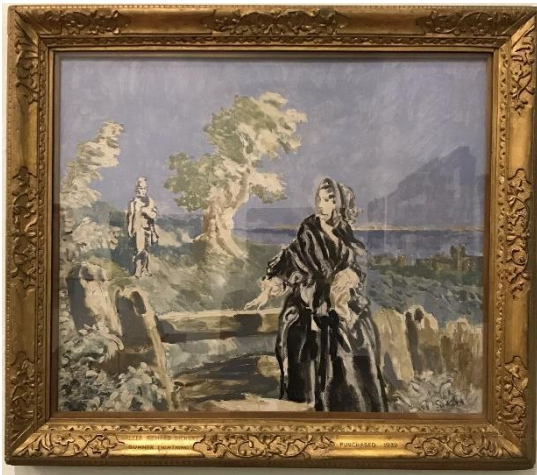
図1 ウォルター・リチャード・シッカート 《夏の雷》

ここまで述べた特徴を、《エコーズ》の代表作とされている《夏の雷》(図1)を例に照らし合わせて検証する。《夏の雷》の原典となった《予期せぬ遭遇》(図2)の作者ジョン・ギルバート(John Gilbert, 1817~1897)は1876年にロイヤル・アカデミー正会員に認定された芸術家であり、シッカートは自身の著作でその素描家としての技術を礼賛している。両作品を比較すると、人物のポーズや背景の形状などはほぼそのまま転写されていることが分かる。一方で原点の画面下部は省略され、人物の立ち位置や縦横の感覚はキャンバスに合わせて調整されている。