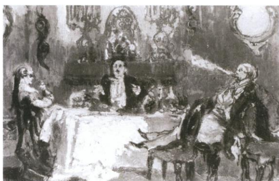
図5 ウォルター・リチャード・シッカート 《椿姫 サー・ジョン・ギルバート R.A からのエコー》 1927年 油彩、キャンバス 42cm×61cm 個人蔵

最初期の《エコーズ》である《椿姫》(1927)(図5)は、その後の作品群の方向性を定めたとも言える作品である。先行研究によれば、《椿姫》の原典となった作品はジョン・ギルバートの《カウント・デ・ジョワイユ、M・デ・ベルボワ、そしてポリティア・デ・シャンバン》(図6)というイラストレーションである 5 。先述のとおりシッカートはギルバートを度々称賛しており、《エコーズ》で作品が引用されている画家の中ではギルバートの作品が最も多いことも併せて、画家の彼に対する尊敬の念は並々ならぬものがあつたと推測できる。