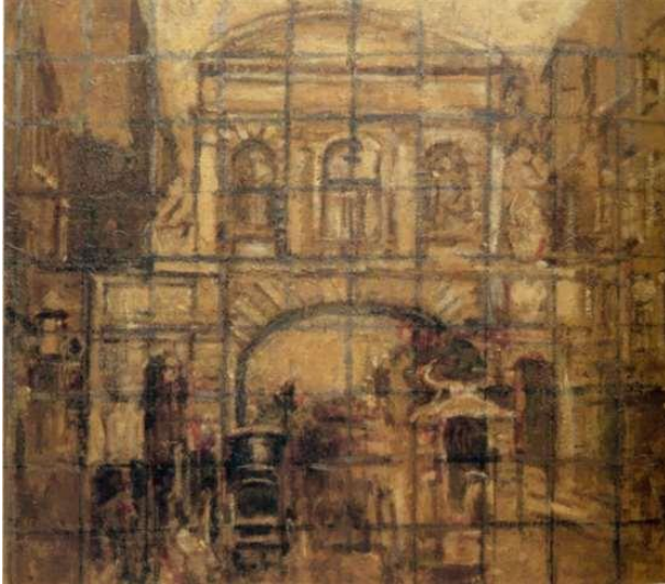
図7 ウォルター・リチャード・シッカート 《テンプル・パー》 1940年 油彩、キャンバス 68.5cm×76cm 個人所蔵