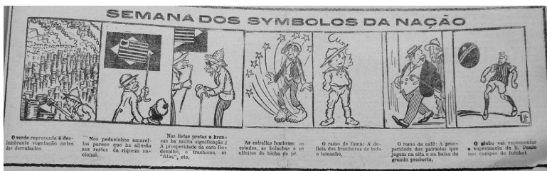
Bild 8: »Der Globus repräsentiert die Überlegenheit São Paulos auf den Fußballplätzen«: Mit diesem Bildtitel drückte die Paulistaner Presse das Paulistaner Überlegenheitsgefühl und den Vertretungsanspruch für ganz Brasiliens auch symbolisch aus. 194

mit brasilianischen zeitgenössischen Phänomenen. Die nationale Flagge selbst zeigte die Karikatur nur umrisshaft, auf den beiden Zeichnungen war sie von der Paulistaner Flagge verdeckt. Mit der Erklärung der Symbole machte sich der Karikaturist zudem über Hinterland-Bewohner lustig und parodierte Probleme wie Krankheit und Armut. Im Gegenzug stellte die Karikatur São Paulo als reich und als Metropole des Kaffeehandels dar. Gleich das erste Bild zeigte São Paulo als Stadt mit seiner beschleunigten Modernisierung: Die abgeholzten Wälder symbolisierten das rasante urbane Wachstum. Das siebte Bild symbolisierte den Globus auf der brasilianischen Flagge als Zeichen für die Überlegenheit São Paulos im Fußball. São Paulo fühlte sich für das Wohlergehen der gesamten Nation verantwortlich.