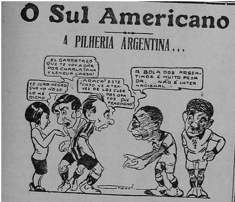
Bild 10: Brasilien in der argentinischen Presse: Die Karikatur zweier afro-brasilianischer Fußballspieler aus der argentinischen Presse, die mit einem argentinischen Spieler über die Größe des Fußballs verhandeln, rief in der brasilianischen Presse Empörung hervor. 87

Auch an anderer Stelle bezeichneten Journalisten die Darstellung der Brasilianer als »negros« als Verunglimpfung, ja als Missverständnis, auch als Ausdruck eines Hangs zur Übertreibung bei den »Platinos«. Ihnen fehle eine Unterscheidung zwischen Farbnuancen, wie ein Autor meinte: »Nuancen existieren dort nicht. Entweder ist er weiß oder er ist schwarz [...].« Derselbe Autor betonte, die Brasilianer seien »generell braun«. 88 In