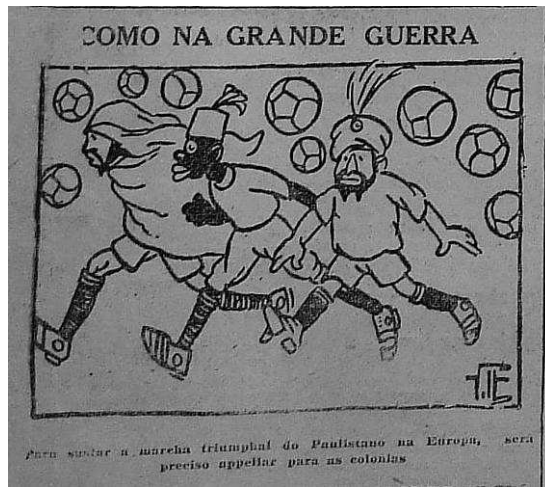
Bild 14: Multiethnizität auf beiden Seiten des Atlantik: Die brasilianische Presse zeigte sich belustigt, dass die Franzosen drei nordafrikanische Spieler einsetzte, um gegen die brasilianische Mannschaft anzutreten. Quelle: »Como na Grande Guerra. Para sustar a marcha triumphal do Paulistano na Europa, será preciso appellar para as colonias«, A Gazeta , 17.4.1925. 204