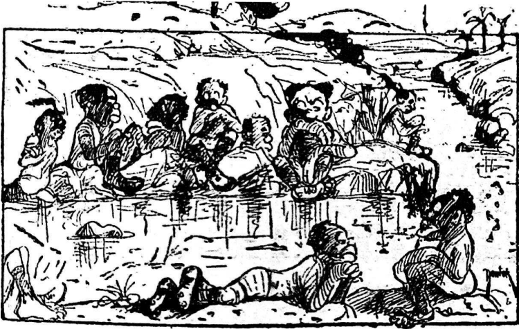
Os players pretos e mulatos, que não embarcaram : Justamente quando podíamos «tomar um banho de prata»... barramos do scratch !...

Bild 9: Der nationale Sportverband schloss 1921 afro-brasilianische Spieler von der Mitnahme zu einem internationalen Turnier aus. Der Karikaturist stellte sie in rassistischer Weise dar, frustriert am Ufer des Rio de la Plata sitzend und liegend. Quelle: »Os players pretos e mulatos, que não embarcaram: Justamente quando podíamos »tomar um banho de prata« ... barramos do scratch!...«, SSOI , 1.10.1921. 76