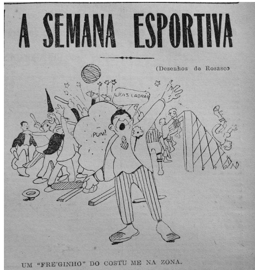
Bild 4: Gewalt im Fußball: Die Karikatur illustriert die gewandelte Wahrnehmung von Fußballspielen in den 1920er-Jahren als chaotisch und gewaltsam. 168