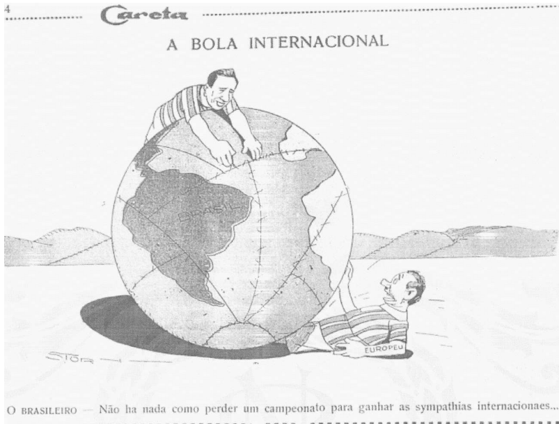
Bild 12: Die Karikatur illustriert die in Südamerika gepriesene Überlegenheit über Europa, ironisiert aber zugleich Brasiliens unauffälligen Auftritt bei der Weltmeisterschaft, durch den Brasilien zwischen »den Fronten« blieb. Der Untertitel lautete entsprechend: »Es geht doch nichts über eine Niederlage in der Weltmeisterschaft, wenn man internationale Sympathien gewinnen will...«. Quelle: »A Bola Internacional«, A Careta , 26.7.1930.

Letztlich hatten mehrere brasilianische Klubs, auch aus São Paulo, die Möglichkeit, sich doch noch an den WM-Teilnehmern zu messen, da einige der Mannschaften, wie die Auswahlen Jugoslawiens, Frankreichs und Nordamerikas, auf ihrer Rückreise in Brasilien Halt machten. Sie traten gegen brasilianische Vereine an und unterlagen. 136 Bei dem Spiel des Klubs Vasco da Gama gegen Jugoslawien kam die Presse zu dem Urteil, die Brasilianer spielten, wie die Südamerikaner überhaupt, einen den Europäern überlegenen Stil, den Jugoslawen fehle »unsere Gewandtheit und unser Ungestüm«. 137