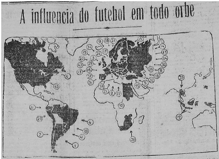
Bild 11: »Der Einfluss des Fußballs auf dem ganzen Globus«: Die Weltkarte teilte die Welt in zwei Hälften, je nach dem, wer von der »zivilisatorischen« Fußballdiffusion erfasst war bzw. nicht. Quelle: »A influencia do futebol em todo orbe«, A Gazeta , 18.11.1926.