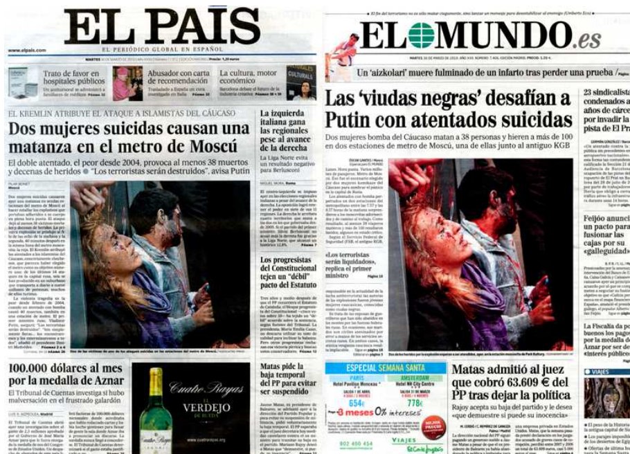
Imagen 3: Saturación de color (2010)

No importa qué herramientas se utilicen para retocar una imagen ni el tiempo que tarde una edición. Algo tan fácil de hacer actualmente como una saturación de color (figura 3) puede generar, si se exagera, un resultado distinto al de la foto original. Las aplicaciones para los dispositivos móviles y para los computadores personales permiten una infinidad de filtros, pasos y efectos para cambiar la imagen. El objetivo de la mayor parte de esas aplicaciones es mejorar las fotografías desde un punto de vista puramente estético. Tal vez la manipulación, como se ha explicado en varias ocasiones, no esté en la imagen antes de publicarla sino en el mismo momento de la impresión. Por error o por intención, los resultados son detectados por los lectores. Las críticas no se hacen esperar, especialmente en las redes sociales.