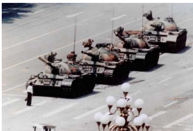
Imagen 6: Fuente: www.elmundo.es/elmundo/2012/06/04/internacional/1338793398.html

Además de la guerra, los conflictos humanos han sido vistos por medio de la fotografía y de la información alrededor de ella parcializados por una u otra parte. El caso más ilustrativo de esta afirmación es el del anónimo hombre frente a los tanques de guerra en la plaza de Tian'anmen. El gobierno chino argumentó el cuidado para proteger al pueblo. Los medios occidentales la usaron como el ícono del poder de la democracia y el liderazgo (Fanjul, 2009).