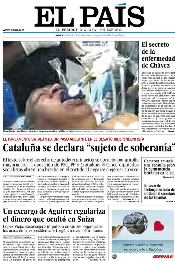
Imagen 5: Fotografía falsa de Hugo Chávez publicada en el diario El País (24 de enero de 2013).

Podemos señalar la fotografía que publicó el 24 de enero de 2013 el diario español El País en su versión impresa y en su portal Web, que mostraba la supuesta imagen de Hugo Chávez (figura 5) entubado en una clínica en Cuba. Sin embargo esta imagen era falsa, se trataba de un paciente acromegálico que nada tuvo que ver con Hugo Chávez (Mosquera, 2015). La imagen fue vendida al diario El País y se trataba de una captura de pantalla extraída de un video que en esos días circulaba por redes sociales (Deltell et al. , 2013).