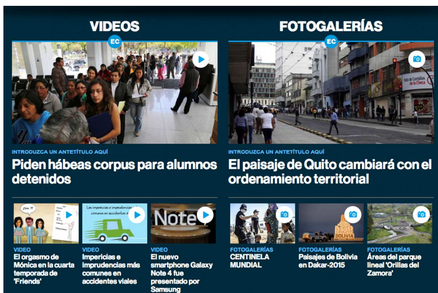
Figura 1: captura de la sección de imágenes y videos del portal Web de El Comercio Fuente: < http://www.elcomercio.com.ec/ > (25 de julio de 2015)

Son las ediciones digitales, blogs y redes sociales de algunos medios los que ofrecen a los consumidores de información reportajes y galerías con mayores contenidos (del Campo Cañizares, 2013) como aparece en la figura 1.