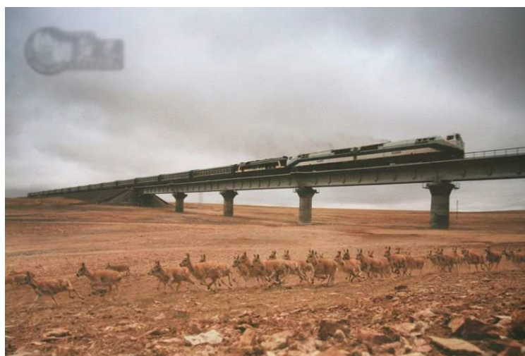
Figura 4: Manipulación de dos fotografías (2006)

Una de las consecuencias que han llegado con el triunfo de la tecnología digital sobre la analógica es que ya no existen los negativos originales de las fotografías, “el problema de la ausencia de negativos es también un problema de memoria histórica” (Sousa, 2003:8); y un problema de memoria histórica es muy serio. La añadidura de un contexto determinado (o la eliminación, como hemos visto) se suma a la posibilidad del engaño y del fraude. Resulta imposible capturar una fotografía sin otorgarle un argumento de contextualización. De esa manera, como acota Wittgenstein “con cada fotografía ocurre lo que argumentaba sobre las palabras: su significado es el uso” (Sontag, 2005:153). Deberíamos añadir que si el uso es rechazado por los espectadores, al menos lo es la intencionalidad de los productores.