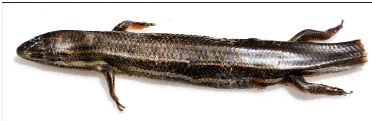
Figura 2. Vista dorsolateral de Aspronema dorsivittatum (LHC= 80 mm; UNSJ- 2633) colectado en el departamento Rawson, provincia de San Juan.

se prolongan desde la región cefálica hasta parte de la cola; ventralmente de coloración grisáceo claro (Gallardo, 1968; Cej, 1993; Cabrera, 2017; Fig. 2).