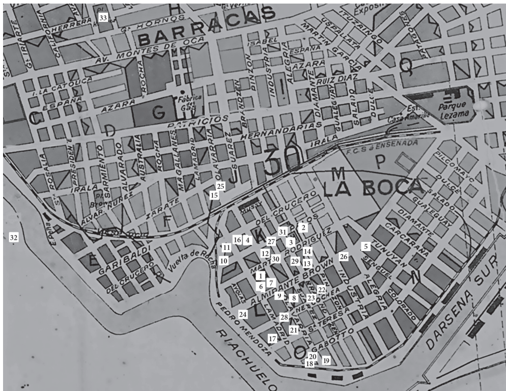
Mapa 1. Vuelta del Riachuelo. Mapa de la ciudad de Buenos Aires y obras de salubridad, abril de 1904