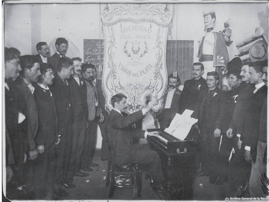
Imagen 2. Ensayo de la Sociedad Coral y Musical Unión del Plata, 1903