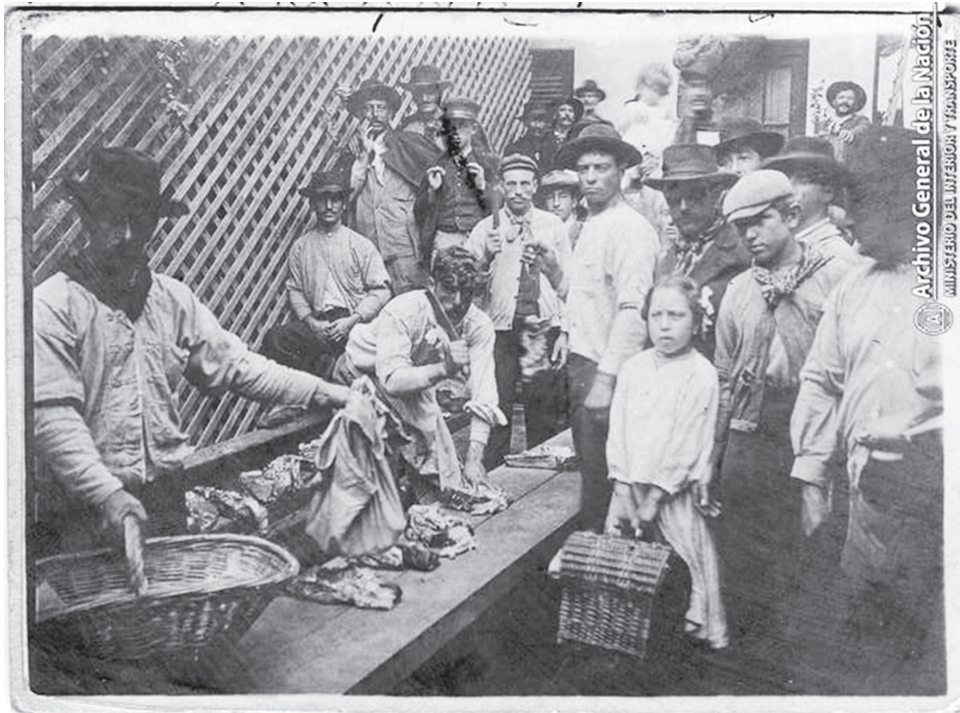
Imagen 1. Reparto de carne entre huelguistas, enero de 1904

Algunos molinos de la ciudad donaron harinas y fideos en cantidad, y un grupo de lancheros hizo llegar al conjunto de los trabajadores en huelga en el puerto dos cargamentos de carbón y uno de leña. Muchas cigarrerías hacían lo propio, mientras que una panadería vecina enviaba tres bolsas de galletas para las familias en huelga, al igual que un depósito de vino. Varias fondas aledañas pedían a las sociedades de resistencia que enviaran cada día entre quince y veinte huelguistas para brindarles el almuerzo. El propietario de una casa en la calle Santa Magdalena ofreció veinte habitaciones gratuitas para huelguistas. A diario, el local de conductores de carros nutría a unos cien trabajadores (hombres y mujeres) y repartía bolsas con estos alimentos a más de cuatrocientas familias del barrio, como muestra la imagen 1. En esta solidaridad amplia y polifónica, el Partido Socialista (PS) y la FOA anarquista tuvieron su voz: ambos llamaron a través de sus periódicos a juntar fondos 40 . Así, de manera colectiva, con la ayuda material y política de comerciantes, vecinos, propietarios, gremios y corrientes de izquierda, la organización concreta de la huelga durante el extenso mes de enero contribuyó a consolidar solidaridades amplias.