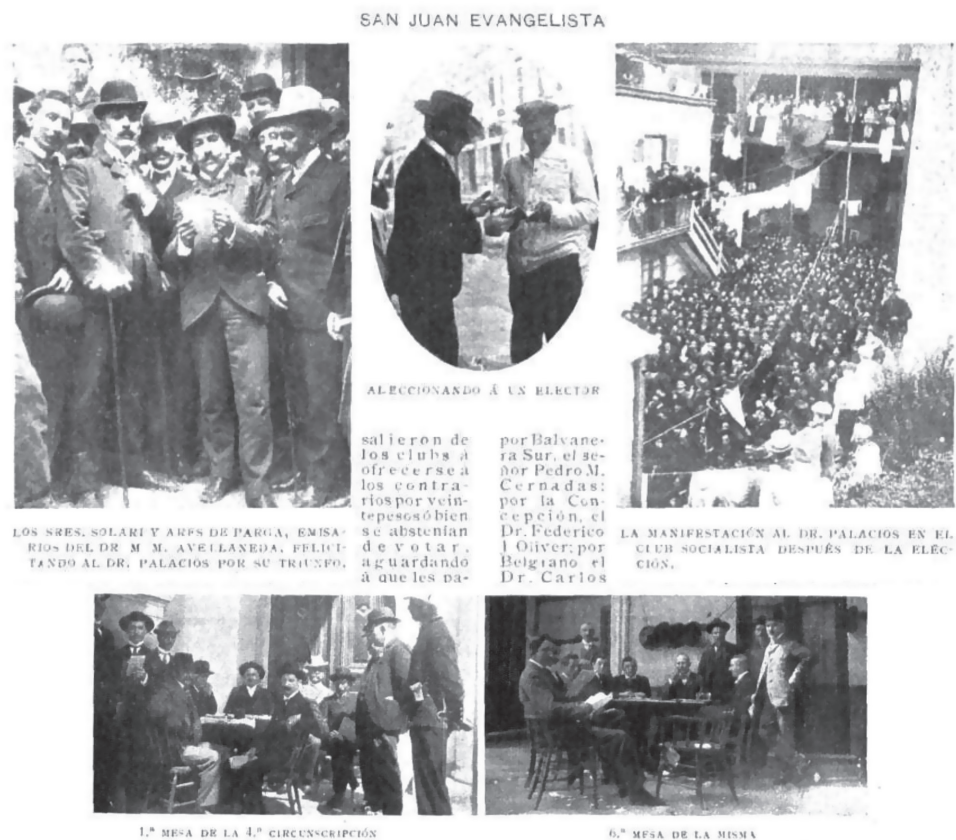
Imagen 3. Diferentes aspectos de la elección de diputados