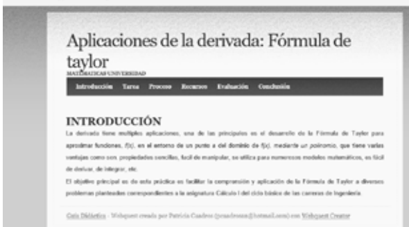
Figura 2: Pantalla de la webquest