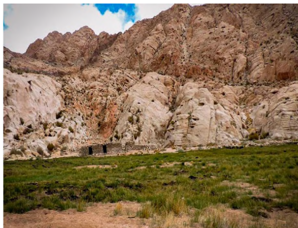
Figura 2. Área de estudio: reserva de biosfera San Guillermo, San Juan, República Argentina.

Se determinaron estadios ninfales del género Dermanyssus sp (Figuras 4 y 5). Para la determinación se consultaron las principales claves propuestas 7, 9, 13, 18, 19 . Además se consultaron las propuestas de los principales caracteres de identificación del género mencionados por 6, 10, 17, 22, 24 .