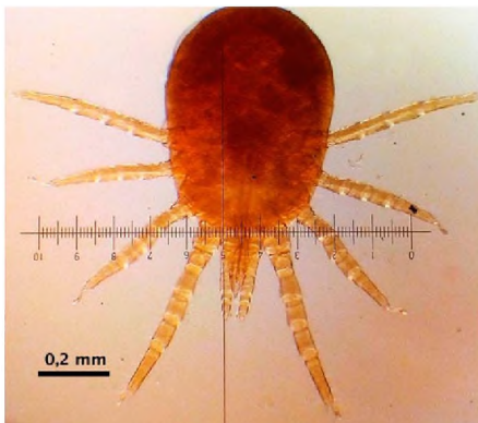
Figura 4. Estadio larval de Dermanyssus sp en el picaflor Oreotrochilus leucopleurus .

Uno de los principales problemas que se presenta a la hora de estudiar la parasitofauna es que las muestras de aves silvestres disponibles para el estudio suelen estar sesgadas por el método de recolección 23 . Debido a los actuales problemas sistemáticos y taxonómicos en el que se encuentra la especie, los autores presentan una revisión histórica del género Dermanyssus sp 19 donde actualmente se incluyen 23 especies.