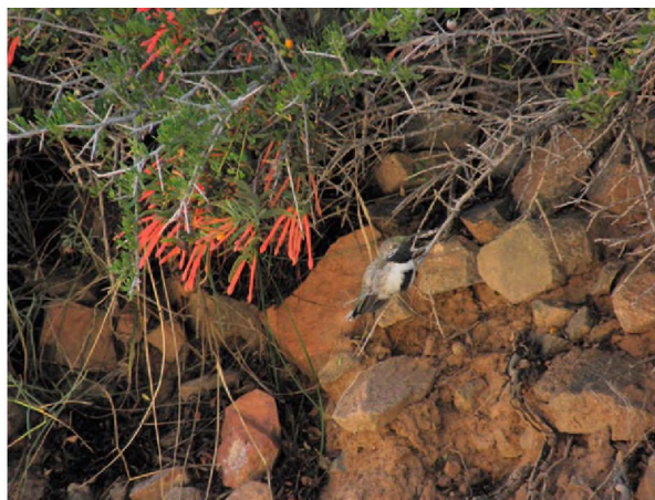
Figura 3. Ejemplar de Oreotrochilus leucopleurus , picaflor andino.