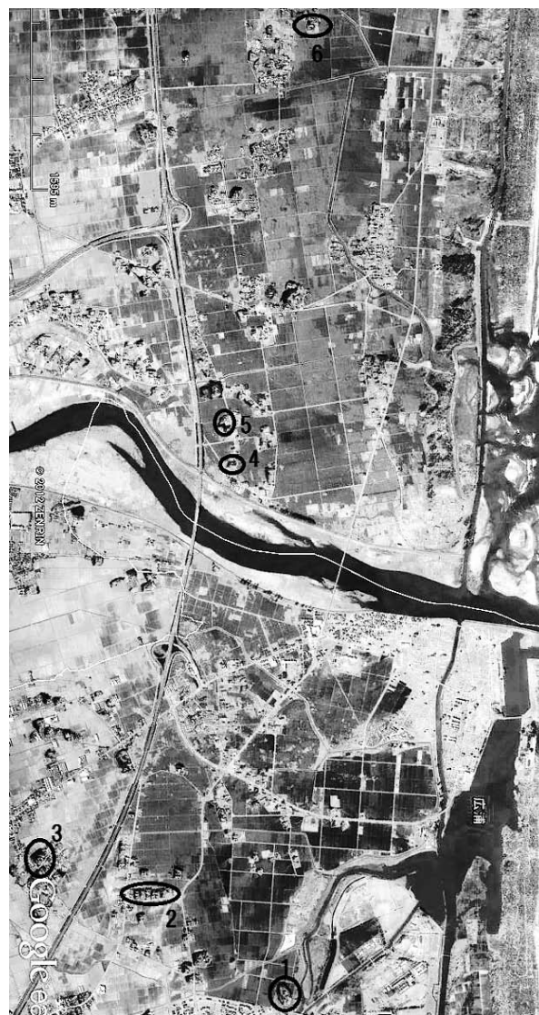
図3 ヒアリング対象地 (google earth 2011/04/08 より筆者作成)

また、瓦礫の分布をみていくと津波の流れも見えてくる。その例として、荒浜地区で大量に発生した瓦礫に着目した。荒浜地区の瓦礫は北西の方向に流れ大沼に多くたまっていた。大沼を越したものは、仙台東IC付近に多くたまっていた。遡上の限界に達し水が比較的早く引いた地域では、瓦礫の溜まり方がはっきりとしている。引き波の影響が色濃く、水田の東端にたまっている。この現象は名取市と共通である。しかし、