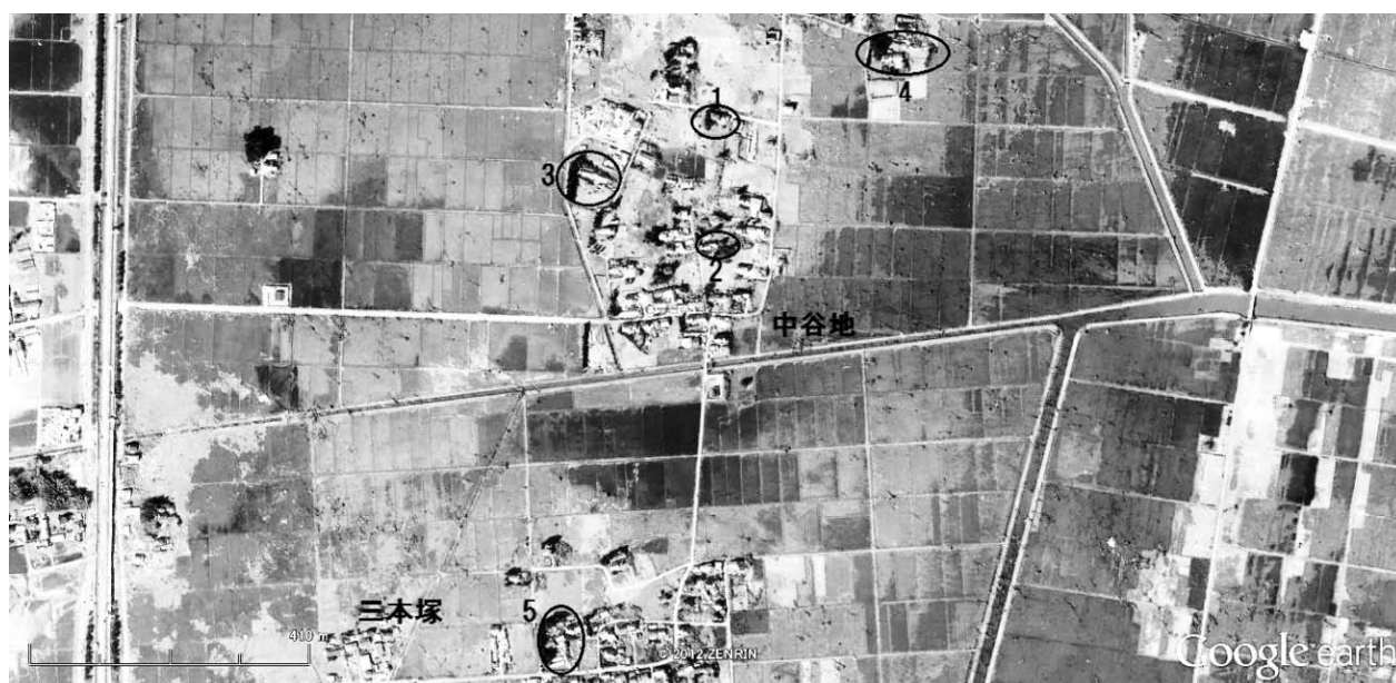
図2 仙台市若林区二木・三本塚地区の被害の実態 (google earth 2011/04/08より筆者作成)

存していたが、ほとんどが枯れていた。被災後の航空写真をみると、いぐねの東側に大量の海岸林が溜まっている。前方の建物は海岸林の衝突によって消失している。東側に仕立てられたいぐねがなければこれらの海岸林が直接家屋に衝突し、建物に甚大な被害を与えた。東側に仕立てられたいぐねの効果は高い。No3農家では、西側に仕立てられた大型のいぐねが残存していたが、こちらも枯れ始めていた。建物の被害は少なかった。その代わり前方にあった木々が流出している。この前方の木々の存在により、背後のいぐねの被害が緩和している。瓦礫の溜まり方をみると、他の地区よりも量が少ない。これは前方の木々によって、津波の流れが北西の方向にずれたためだと考えられる。No4農家では、ヒアリング調査も行った。5軒のうち最も海岸からの距離が近いので、家の周りを取り囲んでいたいぐねの半分が流出した。しかし、東側に仕立てられたいぐねがあったため、こちらでも建物の被害は比較的少なかった。東側にあったビニールハウスが流出していた。東側にもいぐねが仕立てられていたものの、それらの背が低かったため、瓦礫が庭にも多く入り込んでいた。また、周辺の水田には漂流してきた海岸林が多く分布していた。No5農家では、半数のいぐねが失われ、残ったいぐねも枯れ始めていたが、手前の建物は残っていた。ここでは、他の4戸と異なり前方に一直線に家屋が並んでいるため、それらの建物に多く瓦