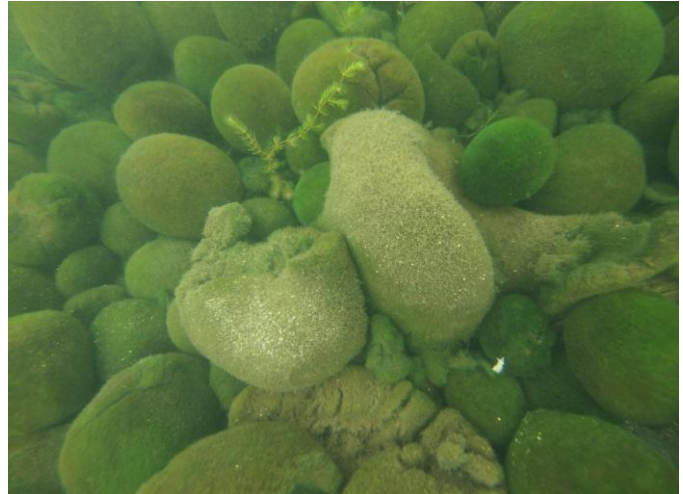
Figure 2. Disrupted aggregations because of having thin filamentous outer layer in Lake Akan.