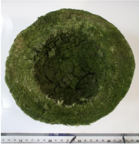
Figure 1. Cutting plane of Marimo aggregation produced the cavity in inside (diameter is about 22cm and thickness of the filamentous outer layer is 4-5cm).