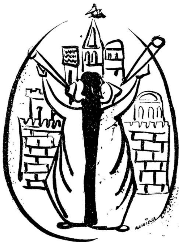
BRUJULA DEL PENSAMIENTO