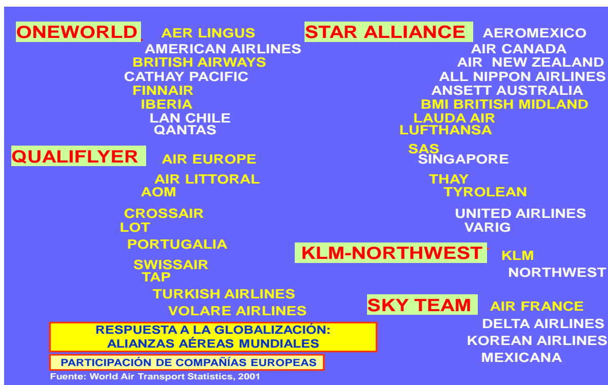
Figura 2. Respuesta a la globalización: alianzas aéreas mundiales en 2001.