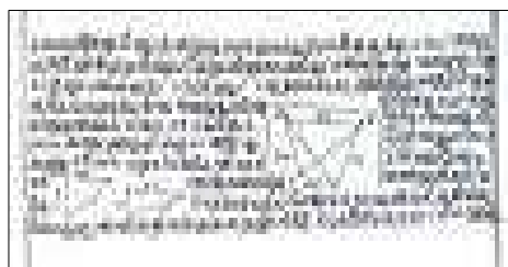
Figura 5. Obra de Bhaskara

Todos estos problemas (y otros más, que pueden verse (Tahan, 2008, p. 130 y siguientes) pueden ser aprovechados por el profesor en las clases dedicadas a la resolución de ecuaciones y sistemas, así como para atender a la diversidad de razas y culturas en sus clases. Sería asimismo muy interesante que el profesor propusiera a sus alumnos una actividad consistente en enunciar en forma de poesía determinados enunciados de matemáticas que condujesen a la resolución del problema por medio de ecuaciones y sistemas. De esta forma, se tratarían además diversas competencias (exigidas en el sistema educativo español en estos niveles), como la social y ciudadana , la cultural y artística y la de autonomía e iniciativa personal , por ejemplo.