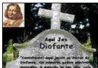
Figura 1. Epitafio en la Tumba de Diofanto

“¡Caminante! Aquí yacen los restos de Diofanto. Los números pueden mostrar, ¡oh maravilla! la duración de su vida, cuya sexta parte constituyó la hermosa infancia. Había transcurrido además una duodécima parte de su vida cuando se cubrió de vello su barba. A partir de ahí, la séptima parte de existencia transcurrió en un matrimonio estéril. Pasó, además, un quinquenio y entonces le hizo dichoso el nacimiento de su primogénito. Este entregó su cuerpo y su hermosa existencia a la tierra, habiendo vivido la mitad de lo que su padre llegó a vivir. Por su parte Diofanto descendió a la sepultura con profunda pena habiendo sobrevivido cuatro años a su hijo. Dime, caminante, cuántos años vivió Diofanto hasta que le llegó la muerte.”