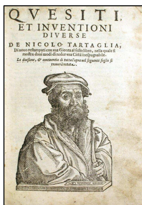
Figura 6. Niccolo Fontana (Tartaglia)

Fontana descubrió un método para resolver ecuaciones cúbicas, pero nunca quiso revelarlo. Otro matemático italiano, Scipione del Ferro, también había descubierto otro método para obtener soluciones parciales de estas ecuaciones. Del Ferro se lo contó a su asistente Fior en el lecho de muerte. Tras unos años, Fontana retó a Fior a una competición matemática: cada uno de ellos le enviaría al otro 30 problemas y ganaría el que resolviese más de ellos en menos tiempo. Fontana le envió a Fior problemas de varios tipos, pero como Fior creía que era él solo el que podía resolver ecuaciones cúbicas, le envió a Fontana 30 problemas de ese tipo. Fontana los resolvió todos en menos de dos horas, ganando la competición de una manera muy brillante. Fontana no quería revelar a nadie su forma de resolver estas ecuaciones, pero finalmente se lo proporcionó a un famoso doctor y matemático, Gerolami Cardano. No obstante, Fontana le contó su método a Cardano en forma de poema, quizás para evitar que cayera en manos de otro matemático rival. Indicamos a continuación ese poema, a pesar de que su traducción del italiano al español resulte un poco “pesada” (en él, la palabra “cosa” representa a la incógnita del problema, denominación habitual de aquellos tiempos):