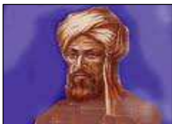
Figura 4. Bhaskara