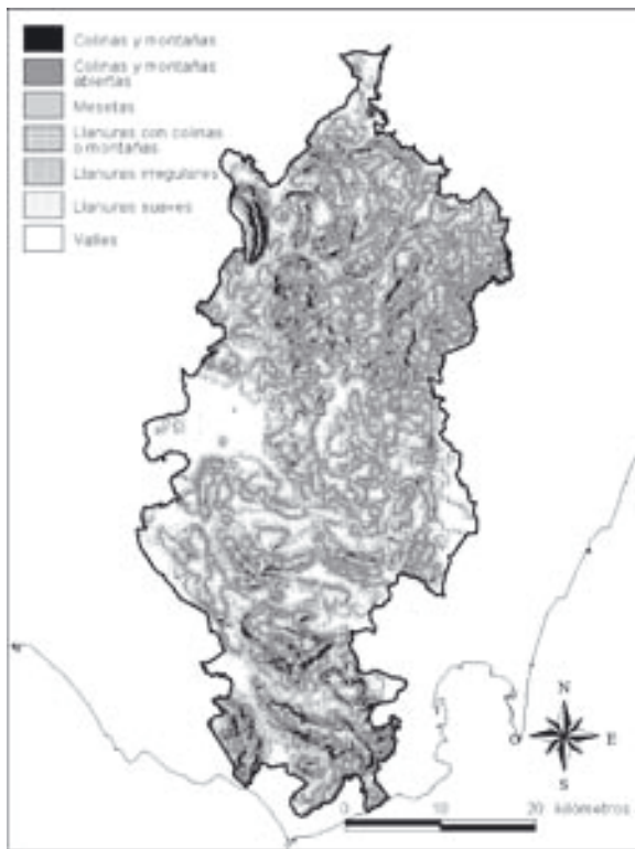
Figura 4. Mapa de formas del terreno. Map of landforms.

En algunos casos en que el sustrato está formado por rocas carbonatadas, como la sierra de las Cabras, la forma del terreno también está condicionada por los procesos de disolución kárstica.