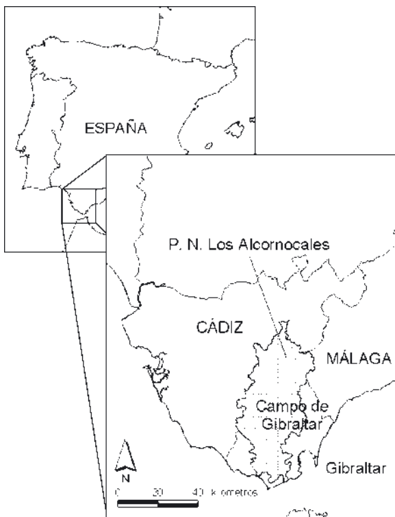
Figura 1. Área de estudio.