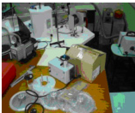
Figura 3. Laboratório de Física

de 99%, respectivamente. Para esta análise foi utilizado o software BioEstat 5.0. Considerando os resultados obtidos, consideramos ter significância estatística na ordem significativa, com probabilidade de erro razoável de 5% -de acertos ao acaso.