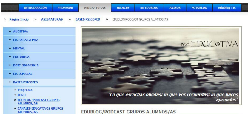
Figura 2. Red educativa de desarrollo y promoción del cambio metodológico en los procesos de E-A universitarios.