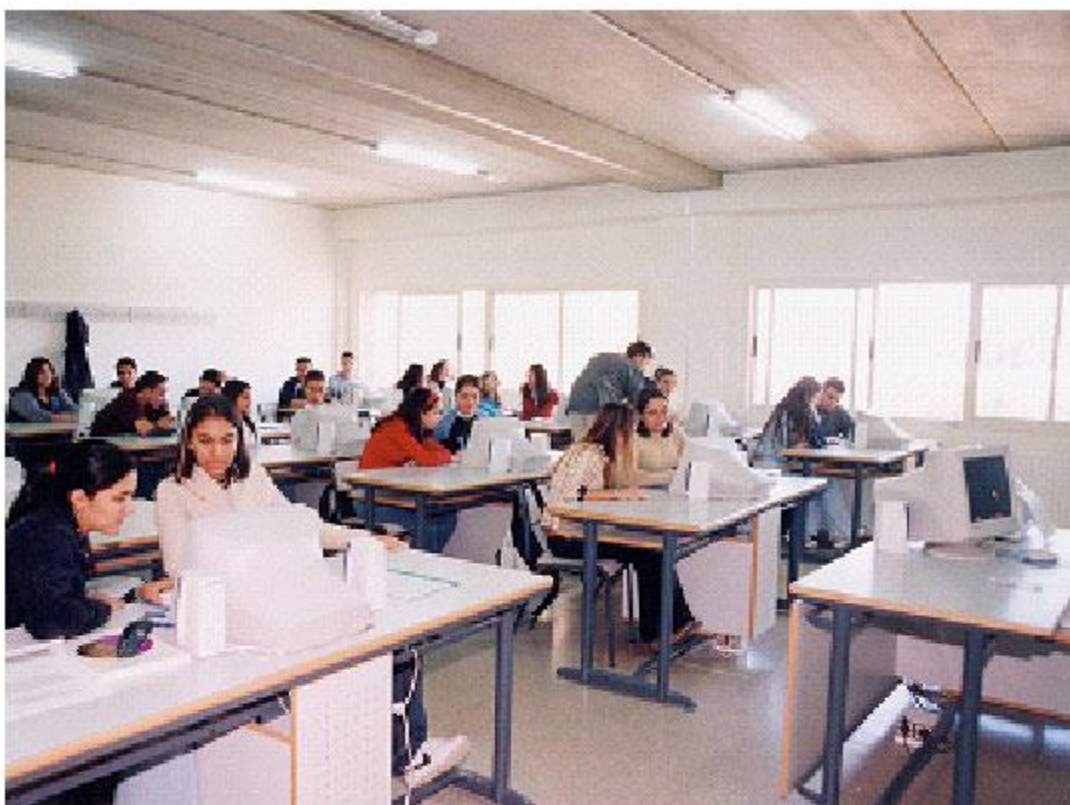
Gráfico 4. Aspecto de un Aula Tecnológica de alumnos de Bachillerato.

A nuestra llegada al centro, nos encontramos con que el IES disponía de una extraordinaria dotación de 462 ordenadores distribuidos por todas las dependencias del centro (zona administrativa, despachos, conserjería, sala de profesores, departamentos