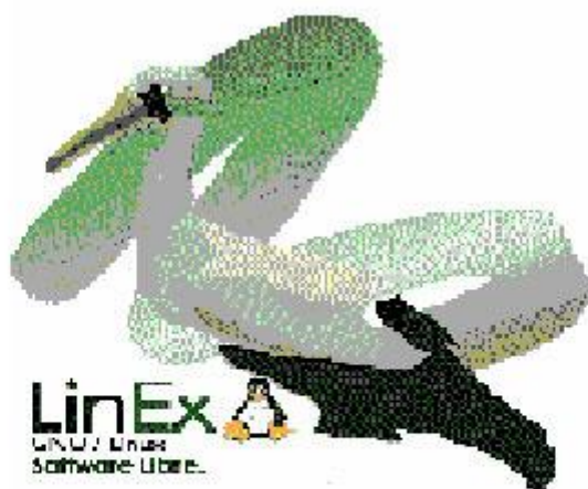
Gráfico 3. GNU/LinEx, el sistema operativo de la Junta de Extremadura.

Para poner en marcha todo este proyecto, la Administración Autónoma extremeña optó por la utilización de software libre en lugar de destinar amplias partidas presupuestarias a la adquisición de licencias de uso por contratos de servicios. Se pensó en un sistema que, apoyado en la participación de todos los usuarios, permitiera realizar y distribuir gratis las copias necesarias y garantizara actualizaciones de acuerdo con las necesidades detectadas a partir de su aplicación en los diferentes centros educativos. Se trata por tanto de un sistema que está siendo mejorado constantemente por una amplia comunidad de usuarios (ver gráfico GNU/LinEx, el sistema operativo de la Junta de Extremadura).