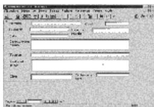
Figura 1. Niveles de dificultad en la interrogación al fichero.