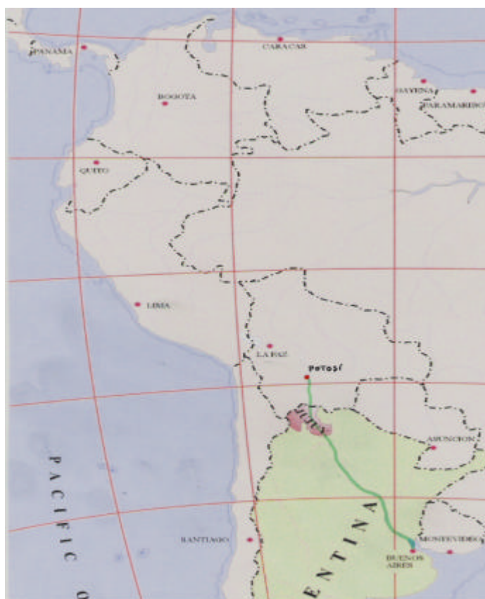
ILUSTRACION 2: Itinerario seguido por José Salinas desde Buenos Aires hasta la villa de Potosí para la venta de los esclavos

enviarán bien acondicionada, procurando sea muy poca o ninguna blanca por ser mejor la colorada.