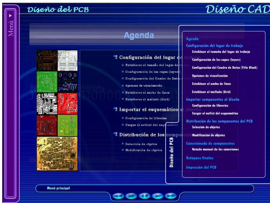
Figura 7. Menú despegable derecho

La película “diseño PCB” es donde se describe el proceso a seguir para llevar a cabo el tercer paso para implementar una placa de circuito impreso, esto es, el diseño del PCB del circuito. Esta película comienza con una animación flash en la que se va mostrando un índice, indicando cada uno de los puntos en los que se va a dividir el tutorial. A la vez que se reproduce dicha película flash se pone a disposición del usuario una serie de menús.