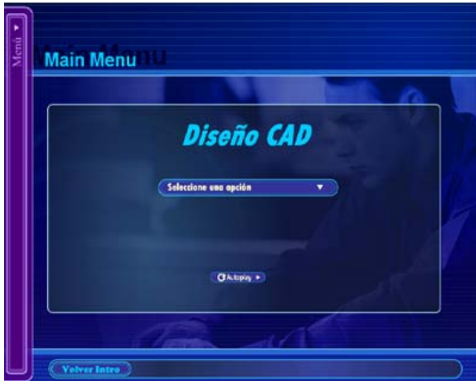
Figura 2. Presentación de menús inicial.

Por otra parte, la película “Enlaces a los tutoriales y a los créditos” nos permite acceder a cada uno de los tutoriales y a la ventana de créditos. El usuario puede acceder a ellos de dos formas distintas: a través del menú despegable de la izquierda o a través del menú central seleccionando una opción. También se puede acceder a ellos haciendo clic en el botón “Autoplay”. A diferencia de los menús, a través de los cuales podemos ir al tutorial deseado en cada momento, el botón “Autoplay” los reproduce empezando por el de “Creación de librerías”, primer paso en la implementación de una placa de circuito impreso.