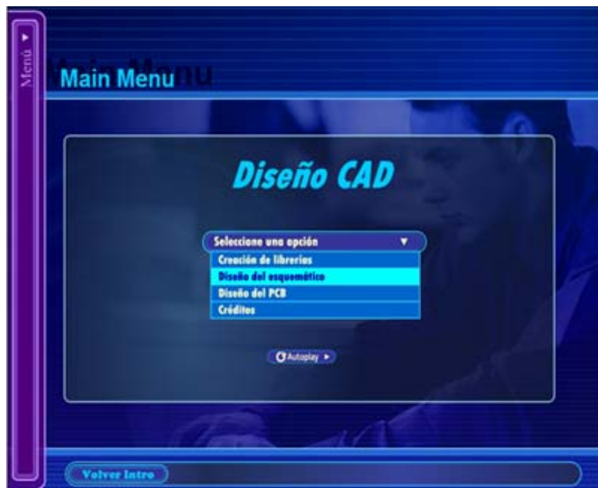
Figura 4. Menú despegable central