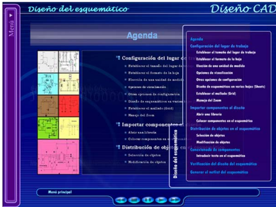
Figura 6. Menú despegable derecho

La película “diseño PCB” es donde se describe el proceso a seguir para llevar a cabo el tercer paso para implementar una placa de circuito impreso, esto es, el diseño del PCB del circuito. Esta película comienza con una animación flash en la que se va mostrando un índice, indicando cada uno de los puntos en los que se va a dividir el tutorial. A la vez que se reproduce dicha película flash se pone a disposición del usuario una serie de menús.