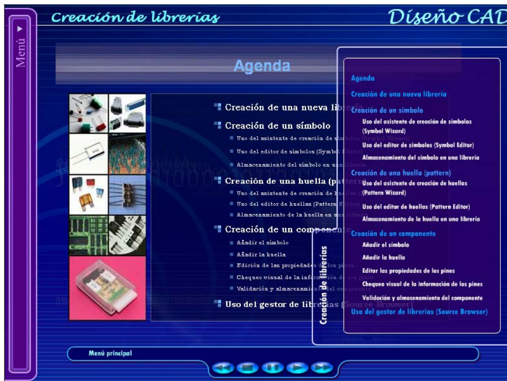
Figura 5. Menú despegable derecho

comentado en el apartado anterior. Sin embargo, el menú despegable de la derecha será distinto para cada tutorial y desde el cual podremos acceder a un punto de este tutorial en cualquier momento.