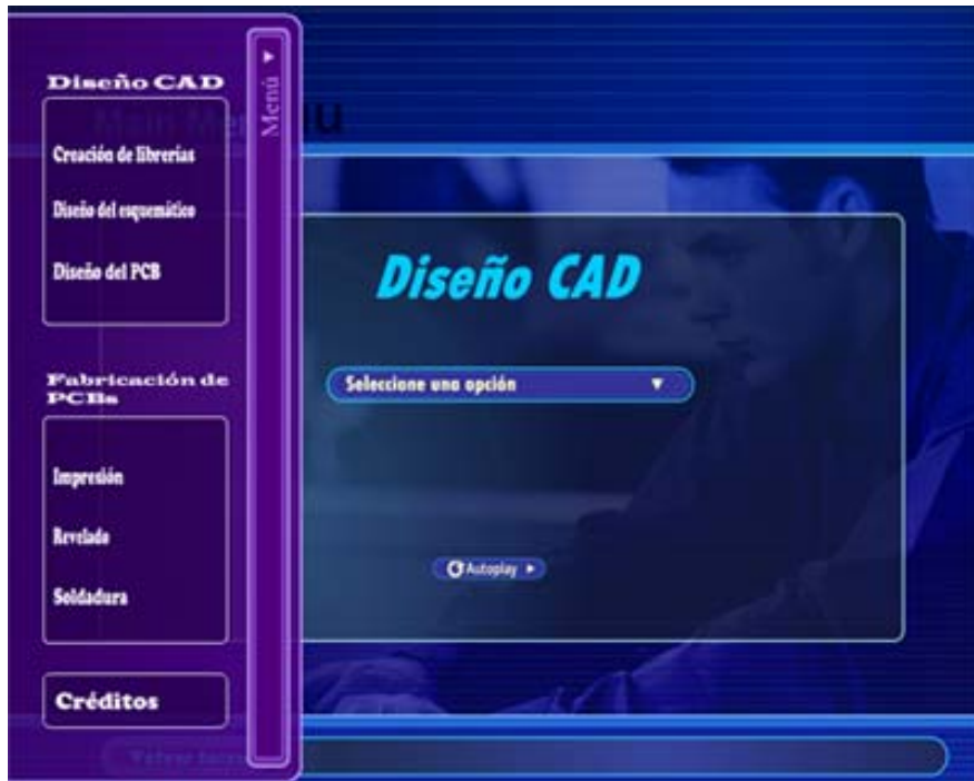
Figura 3. Menú despegable izquierdo