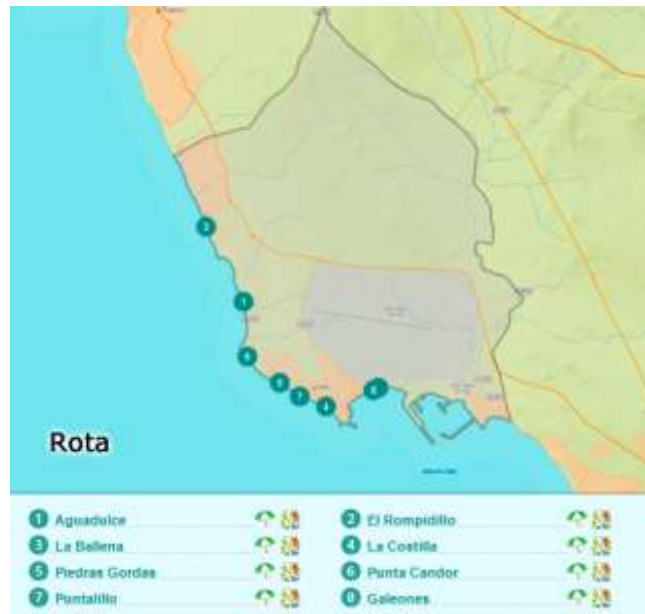
Figura 3.15. Principales playas de Rota