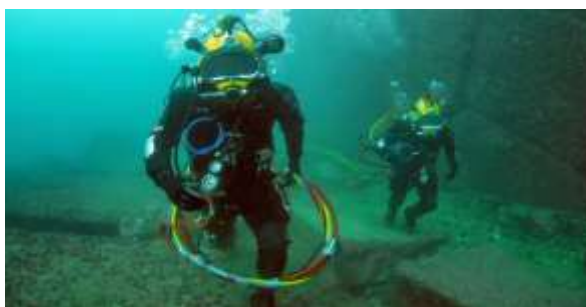
Figura 2.1. Buceo no autónomo

En esta categoría el buceador está conectado mediante una manguera a un equipo de aire que se encuentra en la superficie, lo que no le permite moverse con total libertad. Normalmente se practica con fines científicos (ver figura 2.1.). A pesar de que el buzo se encuentra muy limitado en cuanto a sus movimientos, los tiempos de inmersión son mucho más prolongados. Puede realizarse con la escafandra clásica Helmet o con equipo Hooka.