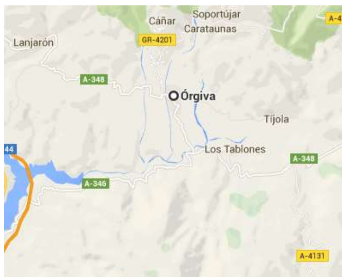
Figura 3.22. Órgiva

Ubicada en plena sierra (ver figura 3.22) está Alpujarra Experience Buceo (ver tabla 3.19.). De esta empresa destaca la complejidad de las inmersiones que realiza principalmente debido a la profundidad a la que trabajan.