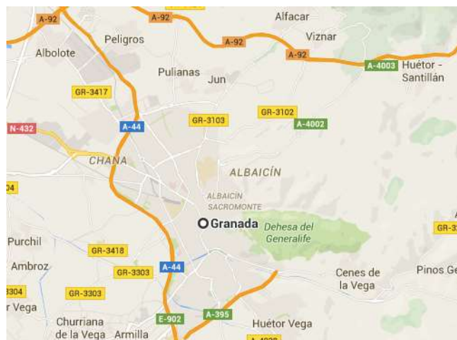
Figura 3.21. Granada

Lejos de la costa granadina (ver figura 3.21.) se ubican un total de 5 empresas (ver tabla 3.18.). Organizan salidas al litoral para la realización de inmersiones de varios niveles y con certificados PADI.