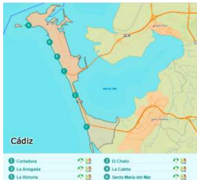
Figura 3.16. Principales playas de Cádiz

En la capital (ver figura 3.16.), destaca el Club Deportivo la Escafandra perteneciente a la FAAS (ver tabla 3.14.), oferta cursos y programan salidas para buceadores experimentados