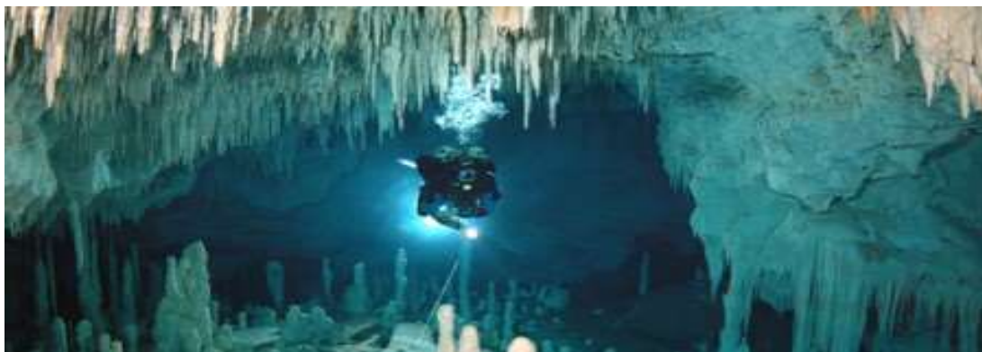
Figura 2.8. Espeleobuceo