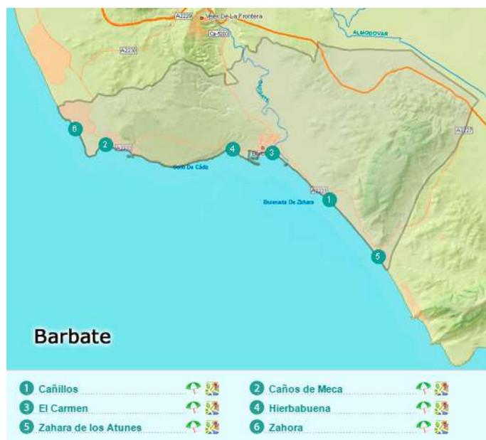
Figura 3.6. Principales playas de Barbate

En el municipio de Barbate (ver figura 3.6.) se localizan tres empresas que ofertan actividades de buceo y otras relacionadas. Las actividades ofertadas se dirigen a todo el público, si bien también ofrecen salidas esporádicas para submarinistas con experiencia. Destaca la empresa Trafalgar Sub que además realiza especialidades de emergencia y protección (ver tabla 3.4.)