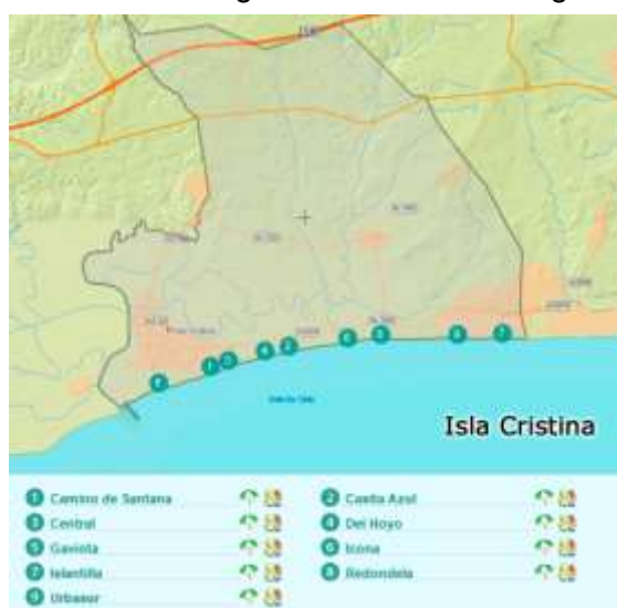
Figura 3.5. Principales playas de Isla Cristina

Isla Cristina (ver figura 3.5.) solo cuenta con Islasub no solo realiza inmersiones en el litoral onubense, también lo hace en algunas zonas de Portugal. (ver tabla 3.3)