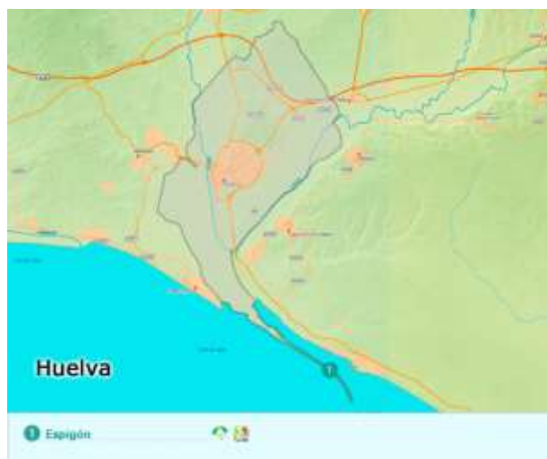
Figura 3.4. Principal playa de Huelva