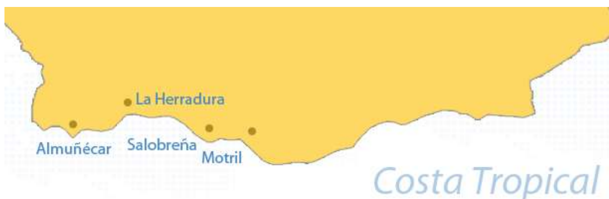
Figura 3.17 Playas costa de la Luz

Situada en el extremo meridional de la provincia de Granada (ver figura 3.16) está formada por diecisiete municipios. Por lo general, el litoral mediterráneo de la costa de Granada vive una intensa transformación de su paisaje debido en gran parte por el conflicto originado por el uso del suelo. Por un lado tenemos el importante desarrollo turístico y las promociones residenciales que está experimentando la costa; en el otro la expansión de una de las actividades económicas más importantes de la zona, la agricultura de invernaderos. A este trance, hay que añadirle el uso propio de las infraestructuras y la red de transportes.