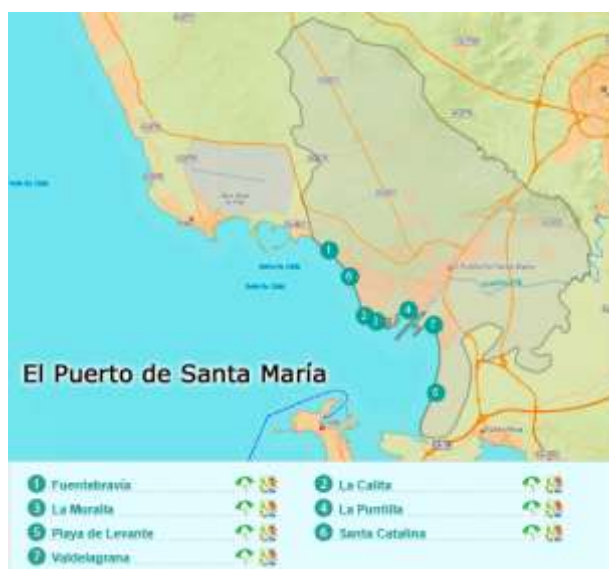
Figura 3.9. Principales playas de El Puerto de Santa María

El Puerto de Santa María (ver figura 3.9.) cuenta con dos empresas que ofertan actividades de buceo y subacuáticas (ver tabla 3.7.), ambas tienen cursos de todos los niveles, además ofrecen tipologías más concretas y opciones de buceo libre por grupos.