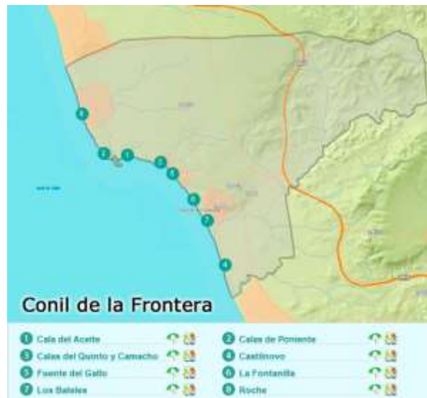
Figura 3.13. Principales playas de Conil de la Frontera

En Conil de la Frontera donde se concentra un turismo más alternativo (ver figura 3.13.) solo existe una empresa (ver tabla 3.11.) que ofrece todo tipo de cursos PADI y una actividad llama “bailando con atunes” que consiste en nadar cerca de esta especie.