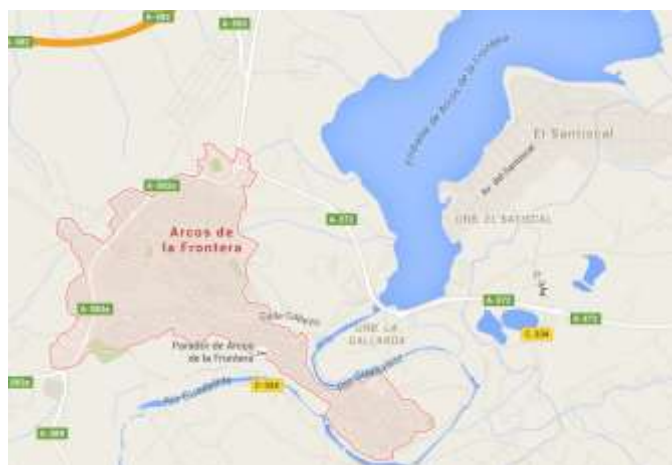
Figura 3.8. Arcos de la Frontera

En el municipio de Arcos de la Frontera (ver figura 3.8.) encontramos dos empresas de esta índole, una de ellas oferta cursos tanto PADI como FEDAS (ver tabla 3.6.), no obstante la empresa Adventure Sport Club Cádiz Buceo es mucho más completa ofreciendo una gran cantidad de cursos como el de primeros auxilios, buceo nocturno, fotografía y además destacan los cursos específicos para niños.