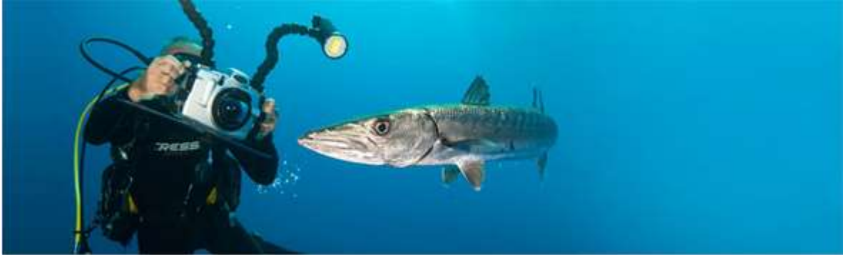
Figura 2.6. Fotografía submarina

Fotografía submarina: se realiza con un equipo de buceo autónomo, normalmente con bombona de aire. La fotografía submarina cuenta con gran complejidad, en parte por el equipo necesario para desarrollarla (ver figura 2.6.). Las cámaras deben contar con aparatos estabilizadores aparte de suministrar iluminación propia.