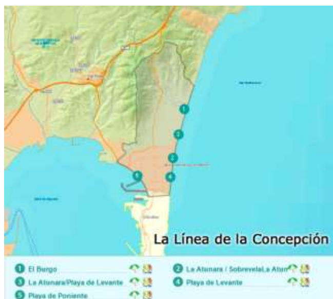
Figura 3.14. Principales playas de la Línea de la Concepción

La Línea de la Concepción (ver figura 3.14.) solo dispone de un Club Náutico aunque ofrece una gran variedad de cursos (ver tabla 3.12.) y actividades relacionadas con el salvamento y rescate.