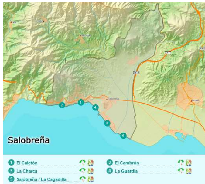
Figura 3.20. Principales playas de Salobreña