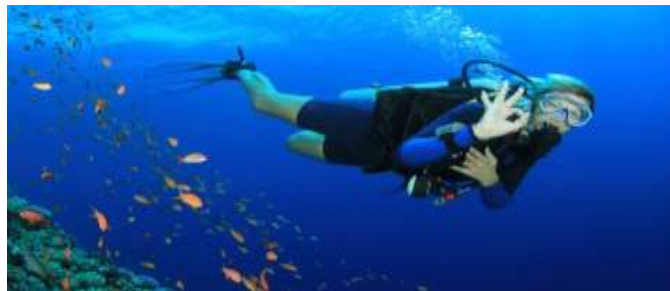
Figura 2.4. Scuba diving

Scuba Diving: es lo que conocemos como buceo, se usa un equipo autónomo de respiración bajo el agua que incluye una bombona llena de aire (ver figura 2.4.). Es la forma más habitual de buceo.