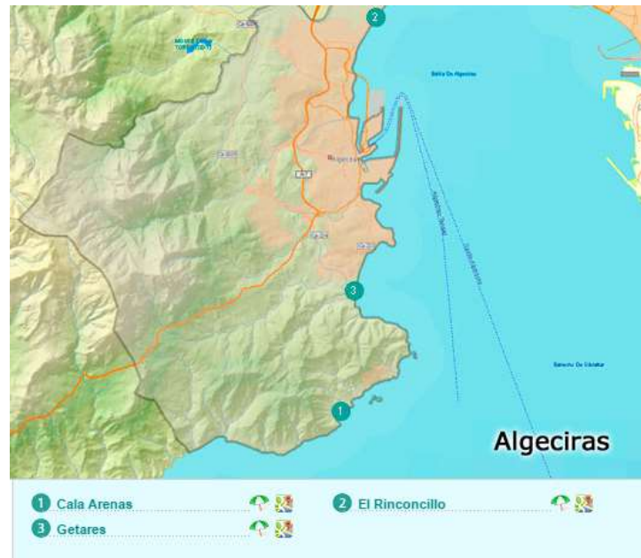
Figura 3.10. Principales playas de Algeciras