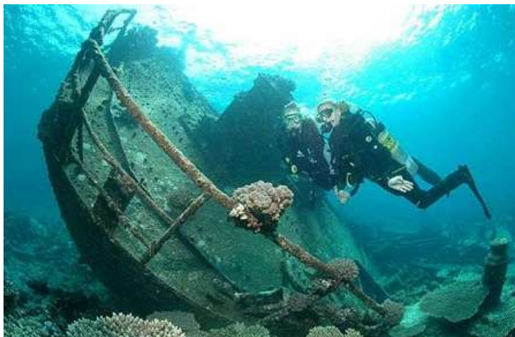
Figura 2.9. Buceo en pecios

Buceo en pecios: modalidad o tipo de inmersión muy característica (ver figura 2.9.). Se trata de inmersiones en un entorno con diferentes estructuras (hierro, madera, acero), en muchos casos con diferentes cotas de profundidad (barcos o restos sobre un fondo en pendiente) y, a veces, próximos a entornos o condiciones adversas (corrientes, escollos naturales, cambios de visibilidad). Para este tipo de buceo es imprescindible tener una titulación avanzada así como un número de inmersiones elevado.