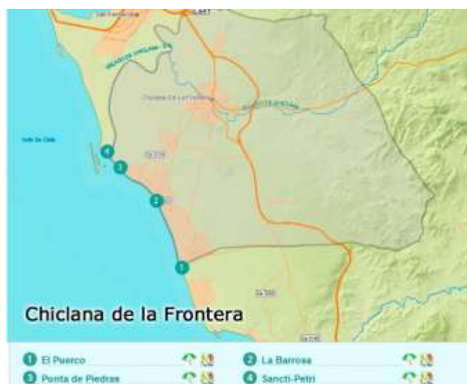
Figura 3.11. Principales playas de Chiclana de la Frontera