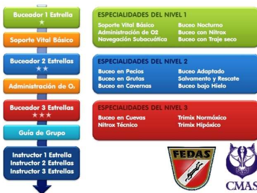
Figura 2.11. Tipología cursos FEDAS

Por su parte, los cursos de la FEDA (Federación Española de Actividades Subacuáticas), (ver figura 2.11), son los únicos cursos reconocidos por CMAS (Confederación Mundial de Actividades Subacuáticas) con equivalencia directa.