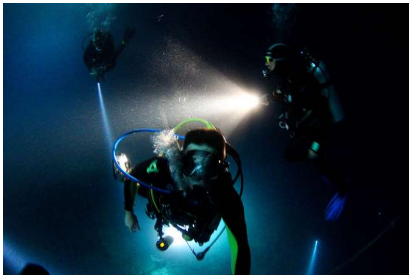
Figura 2.7. Buceo nocturno

Buceo nocturno: se trata de contemplar la vida submarina de otra forma, ya que permite disfrutar de especies que durante el día son casi invisibles como el caso de langostas y pulpos (ver figura 2.7.). Un rasgo al que hacen referencia todos los que practican el buceo nocturno es el color intenso de los arrecifes bajo las linternas, y la diversidad de luz al apagarlas.