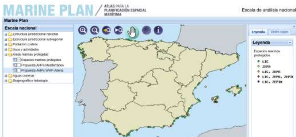
Figura 3.2. Espacios marinos protegidos

Creus, (Girona), Islas Cíes, (Galicia), Formentera, (Islas Baleares), El Hierro, (Islas Canarias), Islas Columbretes, (Castellón) y Menorca, (Islas Baleares).