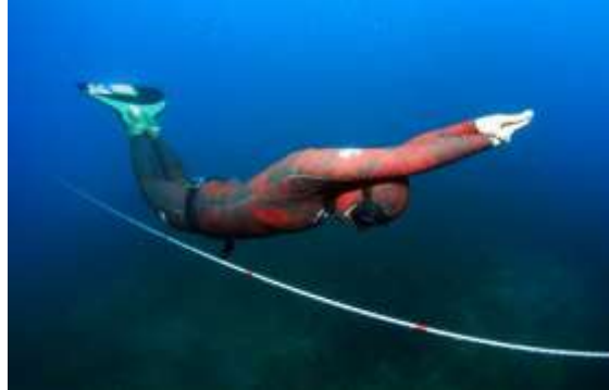
Figura 2.3. Buceo apnea

Apnea: en este caso no se usa ningún tipo de fuente externa de aire, sino que se aguanta la respiración durante el tiempo que dure la inmersión y se sale a la superficie para volver a tomar aire (ver figura 2.3.). Es necesario contar con una buena condición y preparación física.