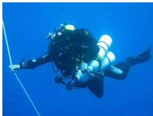
Figura 2.5. Buceo con nitrox

Nitrox: muy parecido al Scuba Diving solo que la bombona en vez de llevar aire, contiene una mezcla de oxígeno y nitrógeno (ver figura 2.5.). Este tipo de modalidad reduce los problemas de descompresión y aumenta los tiempos de inmersión.