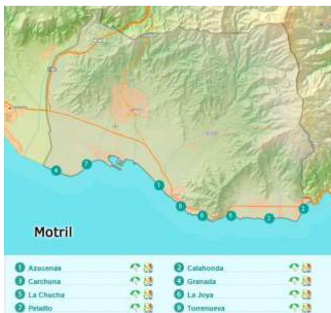
Figura 3.19. Principales playas de Motril

El municipio de Motril (ver figura 3.19.) abarca 5 empresas que realizan actividades vinculadas al turismo de buceo (ver tabla 3.16.), con certificados PADI y varios niveles. Destaca Dive Center Aquamarina por ser la única en la Costa Tropical en tener cursos de buceo adaptado.