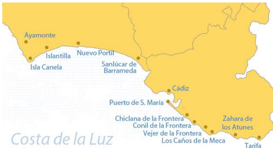
Figura 3.3. Playas costa de la Luz

La Costa de la Luz se sitúa en el suroeste de Andalucía y abarca la zona de litoral de las provincias de Huelva y Cádiz (ver figura 3.3.).