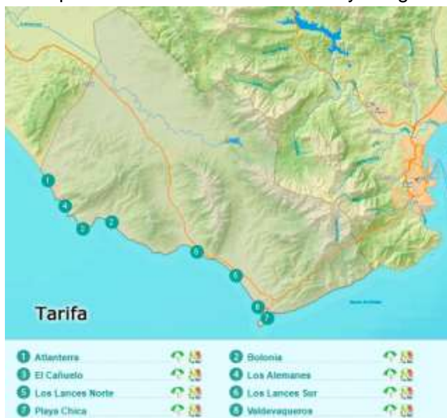
Figura 3.7. Principales playas de Tarifa

En el municipio de Tarifa (ver Figura 3.7.) se localiza el mayor número de empresas que ofertan actividades de buceo y otras relacionadas, un total de siete. Las actividades ofertadas se dirigen a todo el público y varias de ellas alquilan y venden equipo como actividad complementaria. Destacan empresas como Tarifa Cies que dispone de cursos más específicos como buceo de nitrox y fotografía (ver tabla 3.5.)