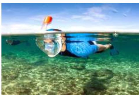
Figura 2.2. Snorkel

Dentro de esta modalidad encontramos una muy común llamada snorkel (ver figura 2.2.), el buceador sigue estando conectado a la superficie solo que esta vez lo hace mediante un tubo. Uno de los extremos siempre asomado sobre el agua para que entre el aire. El equipo es mínimo, además del tubo se precisa gafas y aletas. El atractivo principal es la oportunidad de observar la vida submarina en un entorno natural sin un equipo complicado y la formación necesaria para el buceo, durante largos periodos de tiempo con relativamente poco esfuerzo. El Snorkel es considerado más una actividad de ocio que un deporte.