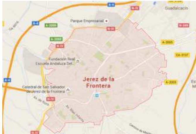
Figura 3.12. Jerez de la Frontera