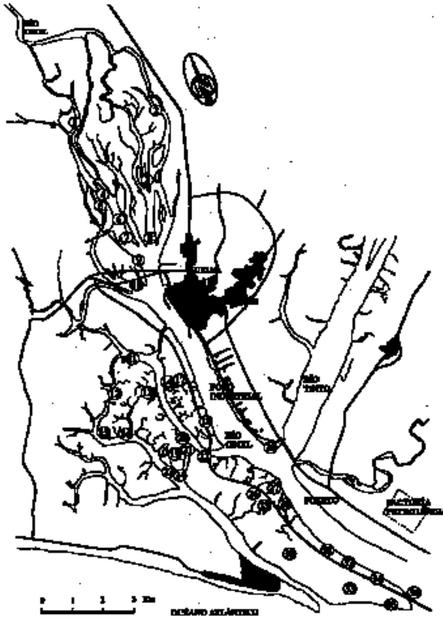
Figura 1. Situación de los puntos de muestreo, repartidos por todas las Marismas del Odiel. Location of sample points in the Odiel Marshes

En las disoluciones, se han determinado todos los elementos, empleándose para ello un aparato Perkin Elmer 2380 de espectrofotometría de absorción atómica. Se realizaron 3 análisis por muestra y elemento. Se han utilizado los patrones oficiales de Perkin Elmer para este tipo de análisis. La llama usada en este procedimiento fue de aire-acetileno. Las concentraciones de los patrones utilizadas en cada caso son las oficiales, efectuándose las medidas en las disoluciones de las muestras convenientemente preparadas y diluidas en su caso para la correcta determinación. Las concentraciones de los patrones y los límites de detección se exponen en la Tabla 2.