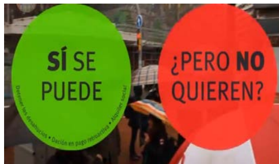
Imagen 2. Logo Sí Se Puede ¿Pero No Quieren?

En varios momentos de los capítulos se insertan los logos donde puede leerse: "Sí se puede", o "Sí se puede, ¿pero no quieren?" Estos logos aparecen en espacios intermedios entre las noticias y también como imágenes de archivo durante las entrevistas. También se recurre a imágenes en las que aparecen pegatinas situadas en distintos puntos de las ciudades o pancartas de diferentes manifestaciones en las que se repite la frase "Sí se puede". A esto se añade la selección de fragmento que retratan a los activistas gritando estos lemas. En la presentación del capítulo 2 se inserta una imagen de una flor que crece en un clima desértico, con lo cual se retrata este marco de esperanza.