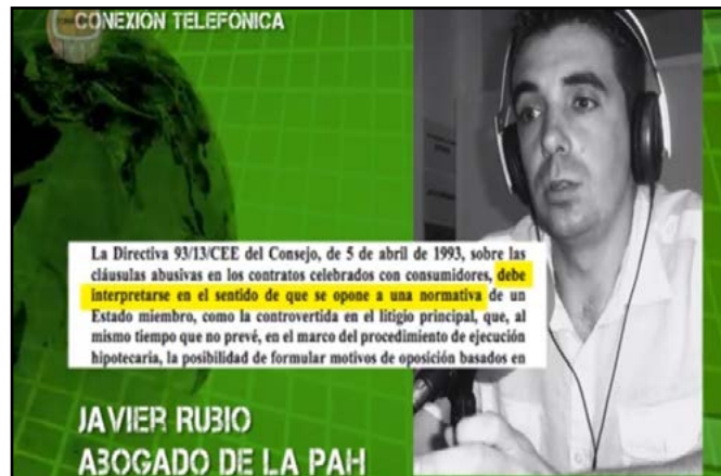
Imagen 1. Inserción de recuadros con información contextual

A nivel de edición, se incorporan recuadros que incluyen fragmentos de normativas como se puede observar en la siguiente imagen (capítulo piloto) y la inserción de información complementaria (que utilizan en el capítulo 3). Otro ejemplo de contextualización es la incorporación de un spot que informa sobre las metas de la PAH.