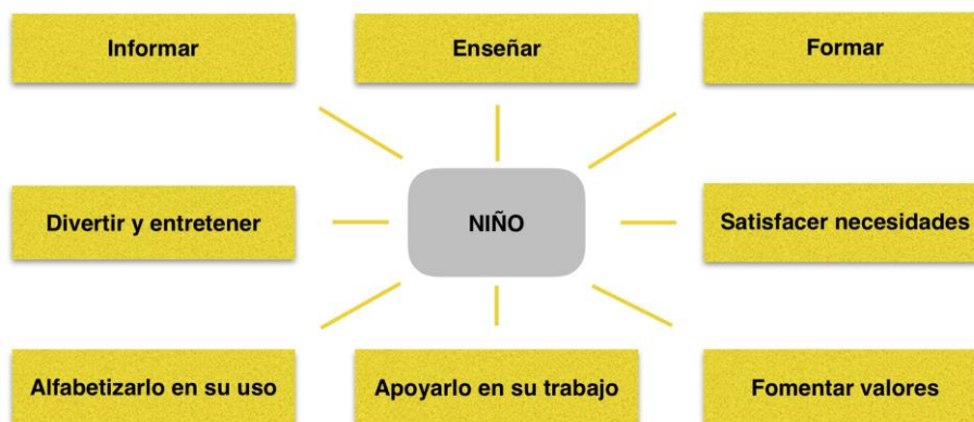
Figura 2. Funciones del ordenador frente al niño (extraído de Sánchez y Vega, 2001).

Los últimos informes internacionales que han revisado la incorporación y dotación de las TICs y de conexión a Internet en las escuelas están evidenciando un incremento sustantivo en la disponibilidad de dicha tecnología en los centros educativos durante el último lustro en los países europeos según Area (2008, p. 5). Sin embargo, otros informes realizados con el objetivo de comprobar si de la mano de estos avances se ha producido innovación en los modelos pedagógicos, han demostrado que estos nuevos materiales se utilizan para continuar con un modelo educativo tradicional. Por lo que se ha llegado a la conclusión de que aunque se esté intentando incorporar las TIC al ámbito educativo, se continúa trabajando con una metodología puramente tradicional.