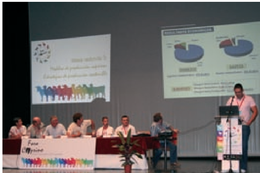
II Foro Nacional de Caprino-Mesa - Modelos de producción caprina: estrategias de producción sostenible.

Entre las causas que a finales de 2007 provocaron el incremento del precio de los alimentos para el ganado, están el uso de alimentos para la producción de biocombustibles, la obtención de malas cosechas en algunas áreas del planeta y la especulación de los mercados. Aunque las empresas lácteas aumentaron también el precio de la leche, no lo hicieron en la misma proporción que el precio de los alimentos. En 2009 el precio de los ali-