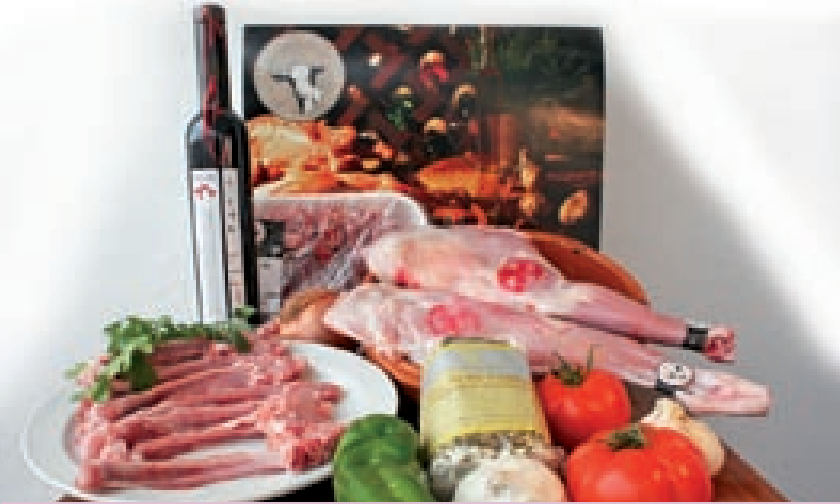
Comercialización de productos de la cabra de raza Malagueña.

2%; otras utilizan la media de los últimos 3 años y otras no han impuesto ningún límite. En los casos en que existe límite, si el ganadero sobrepasa el margen impuesto se le penaliza bajándole el precio del litro de leche.