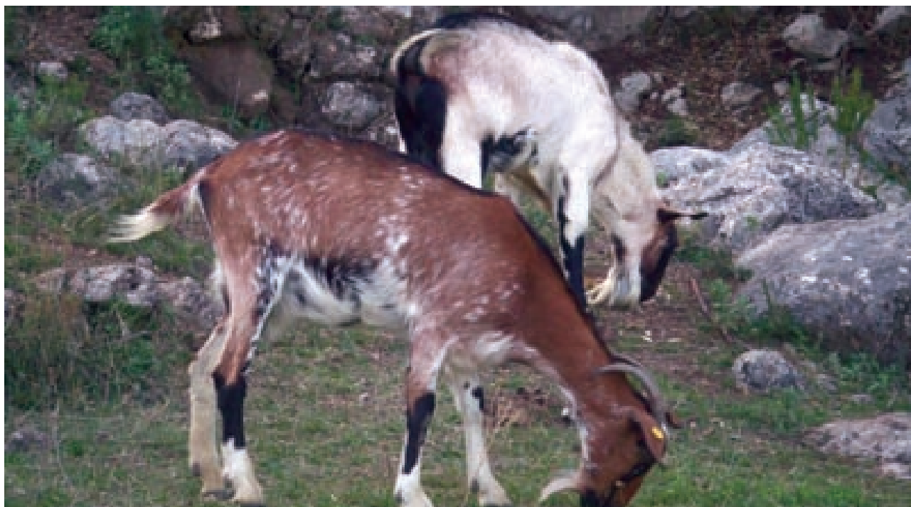
Animales de la raza Payoya en pastoreo.