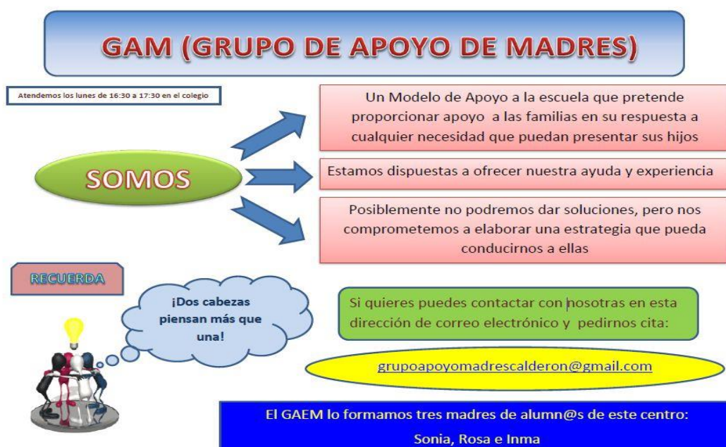
Imagen 1. Publicidad del GAM de padres/madres del colegio Calderón de la Barca (Sevilla) en la página web del centro: http://www.colegiocalderondelabarca.es/index.php/centro/gam-familias (Consultado por última vez, 22/10/2013)

2. Puesta en marcha de los GAM. Los GAM constituidos en el seminario de formación anterior comienzan la fase de publicidad con el diseño de los carteles que distribuirán por el centro. Se acondiciona un espacio para reservarlo como lugar de atención a los demandantes y se incluye esta información en los carteles junto a las horas y días de la semana en la que se encuentra disponible el GAM para atender solicitudes. Mostramos como ejemplo el cartel de publicidad que el grupo de madres/padres tiene colgado en la página web del centro para publicitarlo.