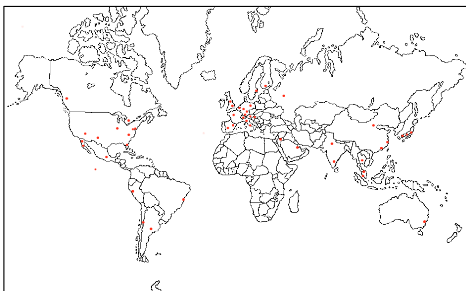
Figura 4.1. - Mapa de hubs o centros neurálgicos de la alianza Oneworld

En el siguiente mapa, observamos las distintas ciudades desde las que opera Oneworld y que forman la red de conexiones de la alianza. Estas ciudades son denominadas centros neurálgicos o hubs y dependiendo de la zona geográfica, serán operadas por unas aerolíneas u otras. Dado el alcance global de esta alianza analizaremos la distribución y organización de los centros neurálgicos a nivel europeo.