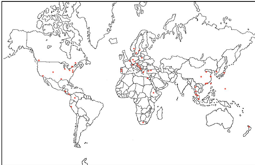
Figura 4.3. - Mapa de hubs o centros neurálgicos de la alianza Star Alliance

En el siguiente mapa, al igual que en el caso de la alianza Oneworld, hemos señalado los centros neurálgicos desde los que opera Star Alliance. Observamos, que posee un mayor alcance global dado al elevado número de miembros en el grupo. Sus principales centros de conexiones se sitúan en Oriente Medio y en Asia, aprovechando la oportunidad de explotar mercados, hasta el momento, desconocidos.