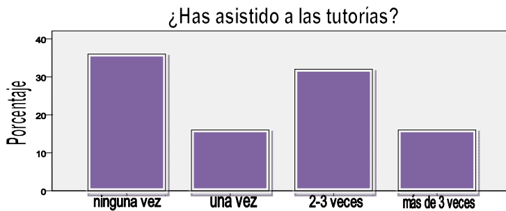
Gráfico 2: Nivel de asistencia a tutorías

Asimismo, más de la mitad de estos/as alumnos/as (el 64%) afirman haber asistido a tutorías al menos una vez, frente a un 36% que argumentan no haber asistido nunca.