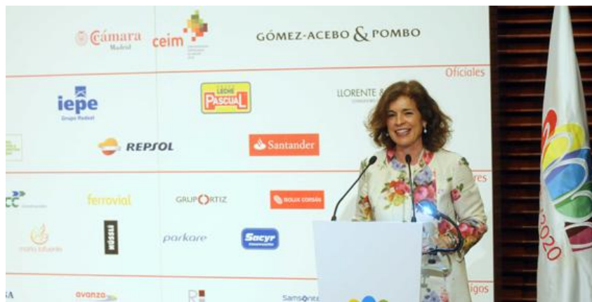
Ilustración 2.1 Ana Botella en el acto de patrocinadores de Madrid 2020.

Como ya hemos mencionado anteriormente, las políticas de austeridad están afectando directamente a las partidas de gasto destinadas al deporte y esto, junto al menor poder adquisitivo que actualmente tiene la población española, dificulta aún más el acceso a las actividades deportivas. En cambio, cada vez son más las empresas que buscan colaborar con eventos, entidades u organizaciones deportivas aportando capital a las mismas. Incluso, muchos ven en esto la oportunidad de para crear más valor para su empresa, revitalizar el empleo y mejorar así el entorno económico.