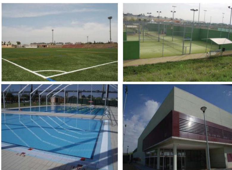
Ilustración 3.2. Complejo Universitario Los Bermejales.

En resumen, en las instalaciones de este Complejo se puede practicar los siguientes deportes: Pádel, Tenis, Fútbol Sala, Fútbol, Rugby, Fútbol 7, Hockey, Aeróbic, Mantenimiento, Taekwondo y Natación entre otros muchos. (Web SADUS)