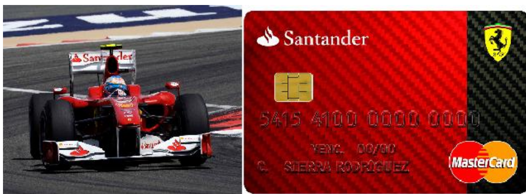
Ilustración 2.2. Publicidad de Banco Santander y Ferrari.