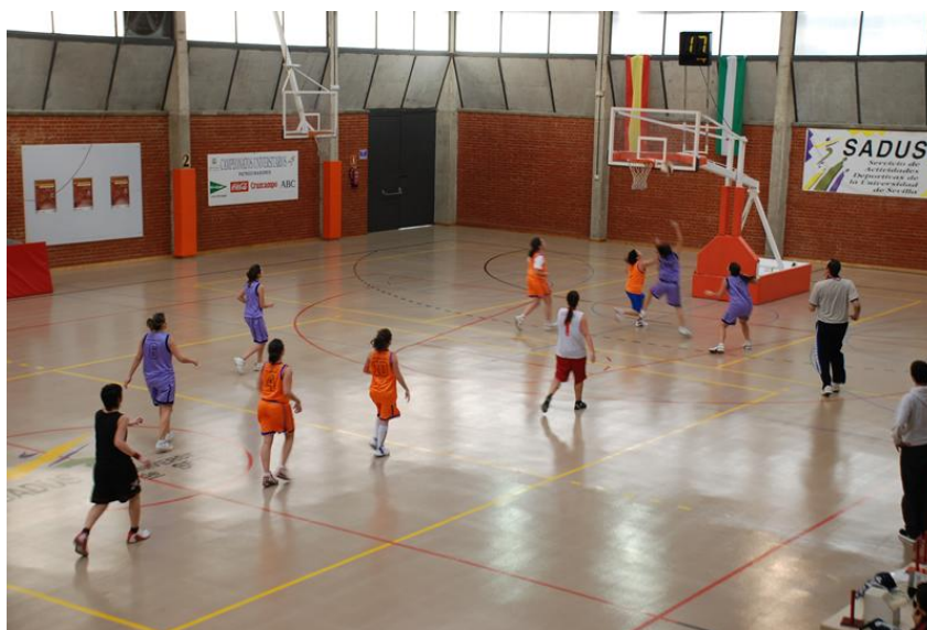
Ilustración 3.1. Pabellón Cubierto de Ramón y Cajal.